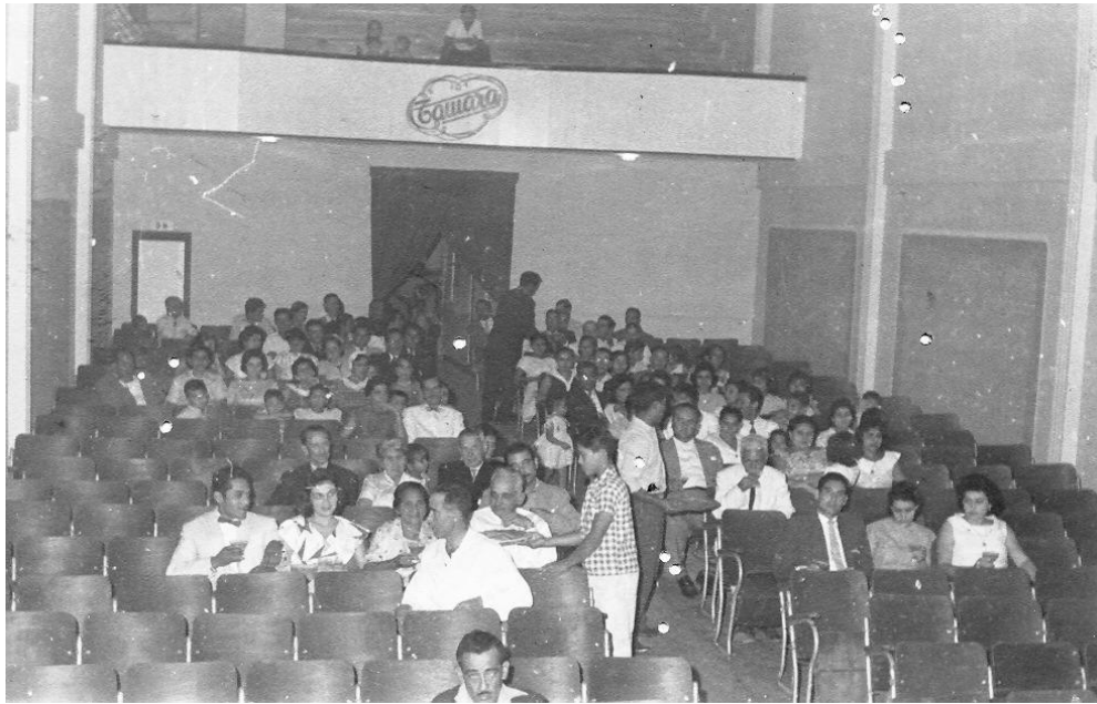
Ilustración del Tamara