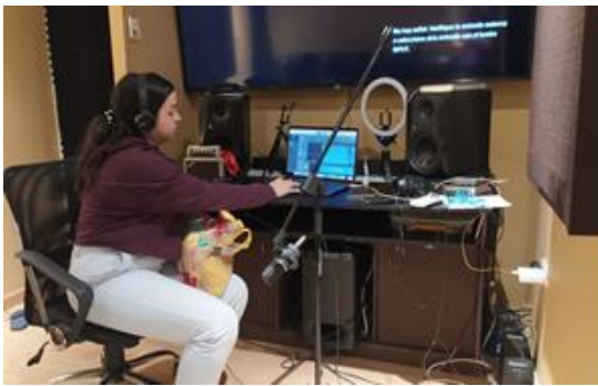
Imagen 1. Edición de sonido en Pro tools

La mayor parte de las fases se realizaron en las cabinas de post producción de sonido en la Universidad de las artes ya que está ambientada acústicamente para tener un buen retorno de los sonidos. También se grabó los foleys en estudio con otra interfaz de audio llamada Motu 8 y el programa garage band que es de fácil manipulación. Más se tuvo que pensar y elegir en los objetos a usar e ir probando cual funciona mejor para simular un determinado sonido que se busca.