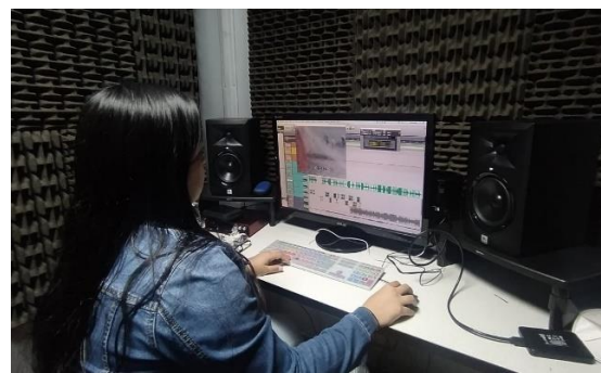
Imagen 2. Grabación de Foleys