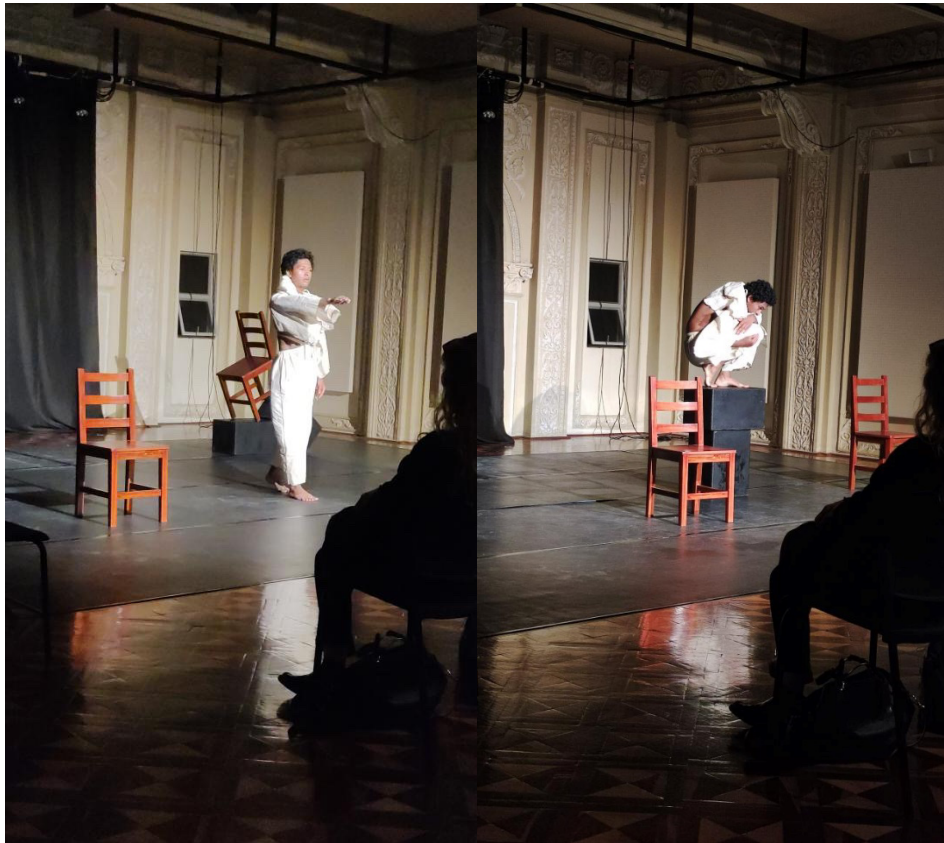
Imágenes de la escena Lo etéreo en mí

Registro pre defensa 17 de agosto de 2022