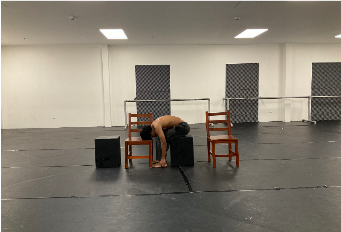
Ensayo con los elementos escénicos en la de una reunión en soledad