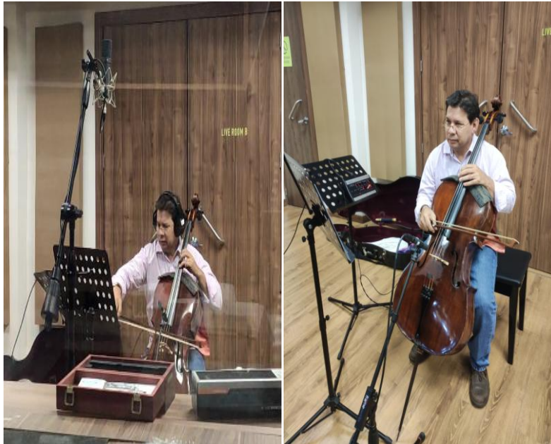
Figura 3.3 Microfonía de Chelo

La batería fue grabada por el maestro Juan Posso para los temas Solamente quiero, Quisiera ser, Recuerda y Sueño, su microfonía se realizó de la siguiente forma: Para el Kick se utilizó un micrófono Electrovoice RE-20, para el Snare Bottom un micrófono Neumann km 184, Snare Top un micrófono Audix i5, Hi Hat un micrófono Neumann km184, para el Tom 1 se utilizó un micrófono Audix D2, Floor Tom un micrófono Audix D6, en los overheads se utilizaron dos micrófonos un Akg C414 para el OH L y otro Akg C414 para el OH R.