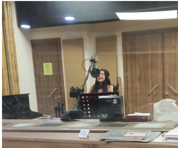
Figura 3.9 Microfonía de voz