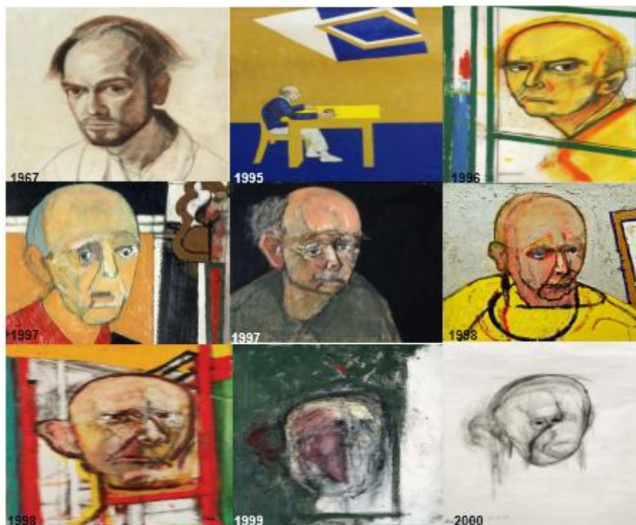
Figura 2.1 Autorretratos de William Utermohlen del antes y durante su proceso degenerativo 14

La figura 1 comprende autorretratos del artista William Utermohlen, el primero que se puede apreciar es del año 1967 donde gozaba buena salud, el segundo retrato que comprende esta figura muestra la reacción del artista al enterarse que tiene Alzheimer, como se puede observar en la imagen del año 1995 muestra la incertidumbre que el artista tiene al no saber lo que pasará, que se puede reflejar tanto en las tonalidades de su pintura como en la forma pintarse a sí mismo.