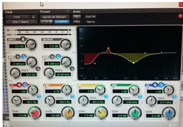
Figura 4.10 Ecualizador

En cuanto al bajo se ha trabajado en la ecualización de las frecuencias medias graves y medias altas, debido a que el bajo presenta florituras en su dinámica, de manera que no haya un enmascaramiento entre este instrumento y el piano o con el bombo, por eso también se ecualizó el bombo de manera que se atenuaran aquellas frecuencias que el bajo iba a utilizar durante la producción.