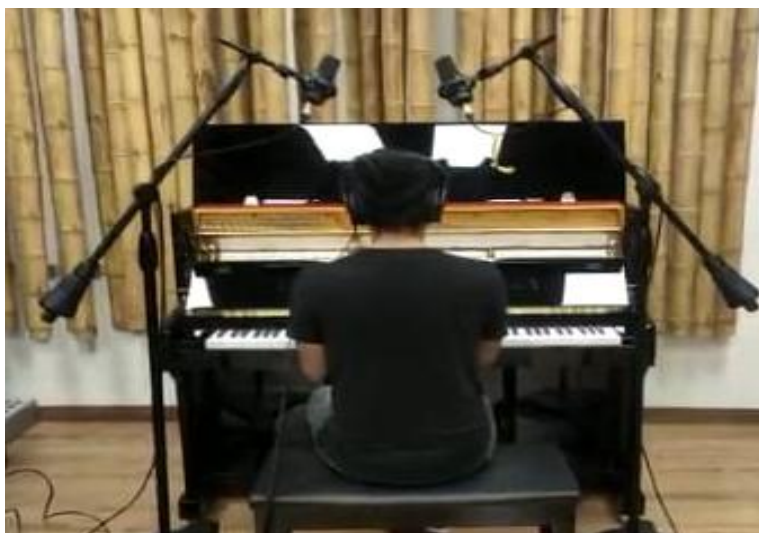
Figura 3.7 Microfonía de piano