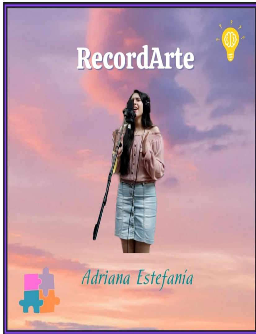
Figura 4.11 Portada