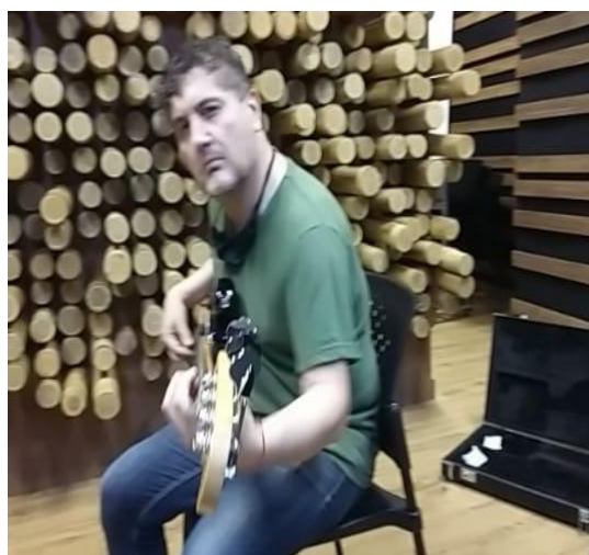
Figura 3.8 Grabación Bajo