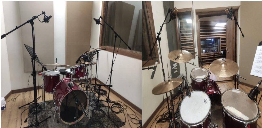
Figura 3.4 Vista de la microfonía desde la perspectiva del público y del baterista

Se puede apreciar en la parte izquierda de la figura la microfonía de la batería desde la perspectiva del público y en la parte derecha se puede ver la microfonía de la misma, pero desde la perspectiva del baterista, estas dos vistas son importantes para el concepto de la mezcla.