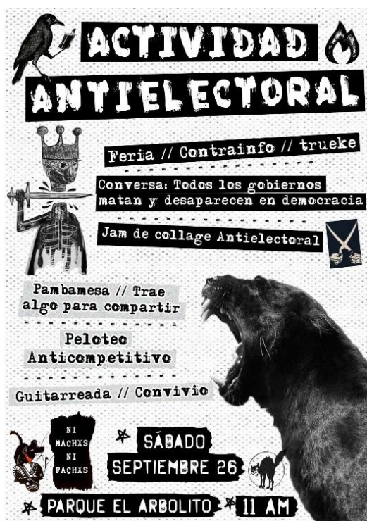
Imagen 3. Cartel para Actividad Antielectoral. Autora Kaos i Katarsis . Septiembre 2020

En la jornada anti electoral, a la cual se refiere la imagen 3, se hicieron conversaciones contra la democracia representativa, se jugó fútbol anticompetitivo, se hizo una pequeña feria y se compartió junto a una pambamesa 155 . Ciertamente las acciones entorno a crear ideas paralelas a las estructuras democráticas fueron un interés constante de este espacio.