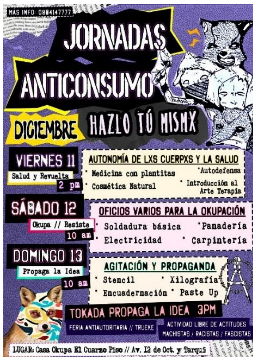
Imagen 2. Cartel para actividad de Jornadas Anticonsumo. Autora Kaos i Katarsis . Diciembre 2020

Melucci respecto de los límites de compatibilidad dice que estos se quiebran cuando una lucha busca “cambiar la estructura de la toma de decisiones” 153 , cuando “ la acción colectiva implica la redefinición de las fronteras existentes en esa organización” 154 . Desde las acciones de limpieza hasta las acciones reivindicativas de juntanza antidemocrática, estas estuvieron encaminadas a buscar otras fronteras que desafíen las estructuras identitarias de la democracia capitalista. Las acciones hacia adentro del espacio como la construcción de maceteros verticales en el techo, la autogestión en la venta de pan para comprar la refrigeradora, buscan encontrar tanto relaciones afectivas, como maneras de relacionarse que no estén basadas en transacciones económicas o en liderazgo empresariales. Estas autogestiones buscan establecer líneas de apoyo mutuo hacia adentro de la colectividad como hacia afuera, que no estén mediadas por el estado o el capital. Las acciones reivindicativas de igual manera se las piensa antagónicas al discurso del estado nación. Aquí dos gráficas que retratan estas posturas: