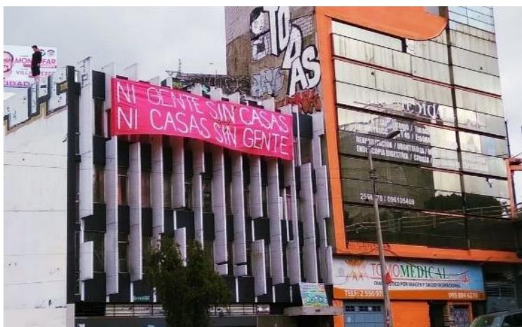
Imagen 4. Ni Casas sin gente ni gente sin casas . Autor Anónimo. Tela colgada en el edificio okupado por lxs actorxs colectivos de Cuarzo Piso .

Las formas de acción de estos espacios al girar en torno a un espacio expropiado, en contra de la propiedad privada, son en sí incompatibles con él sistema. Estas acciones no solo nacen de narrativas antagónicas sino buscan también discursos que se desarrollen en plataformas que no respondan a las lógicas ciudadanas.