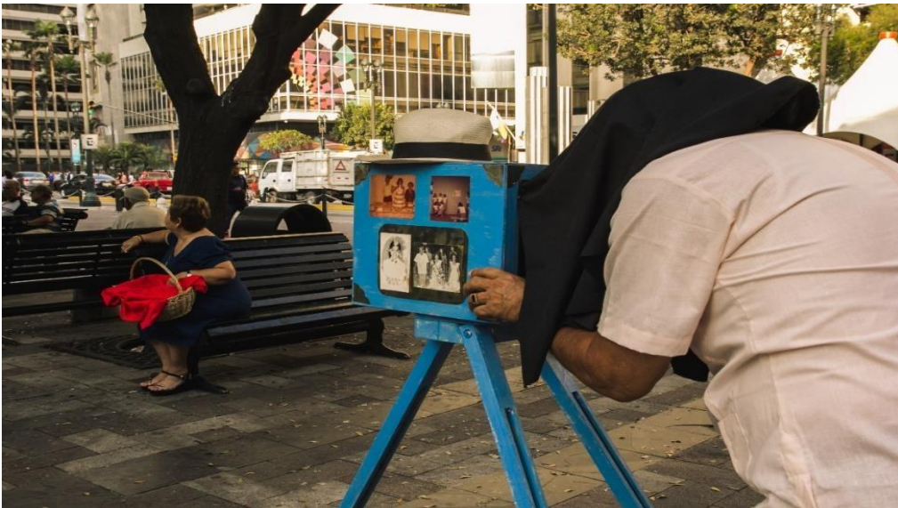
Figura 5. Sesión de fotos para el postcards Moposita, 2019