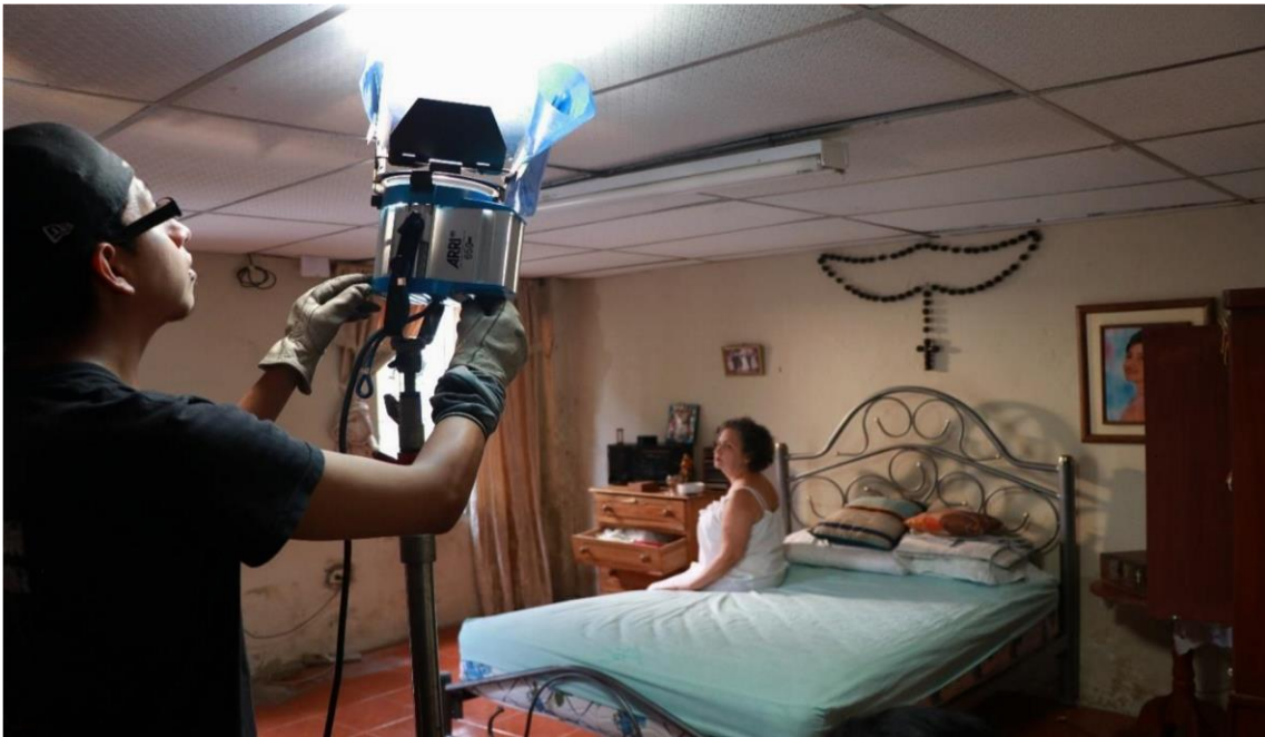
Figura 18. Rodaje 5 Moposita, 2019