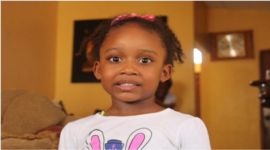
Figura 13. Casting 2