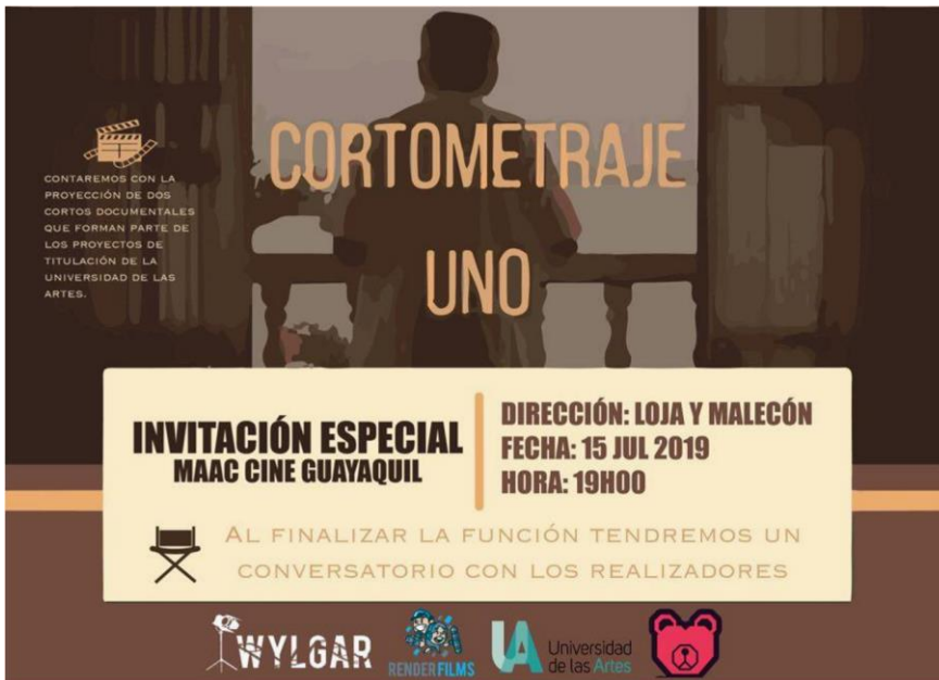
Figura 23. Proyección 1