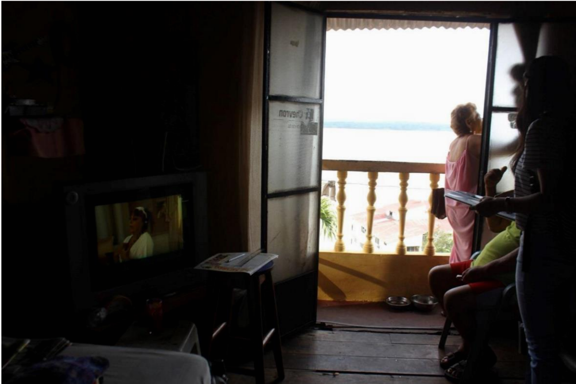
Figura 9. Visita de locaciones 3