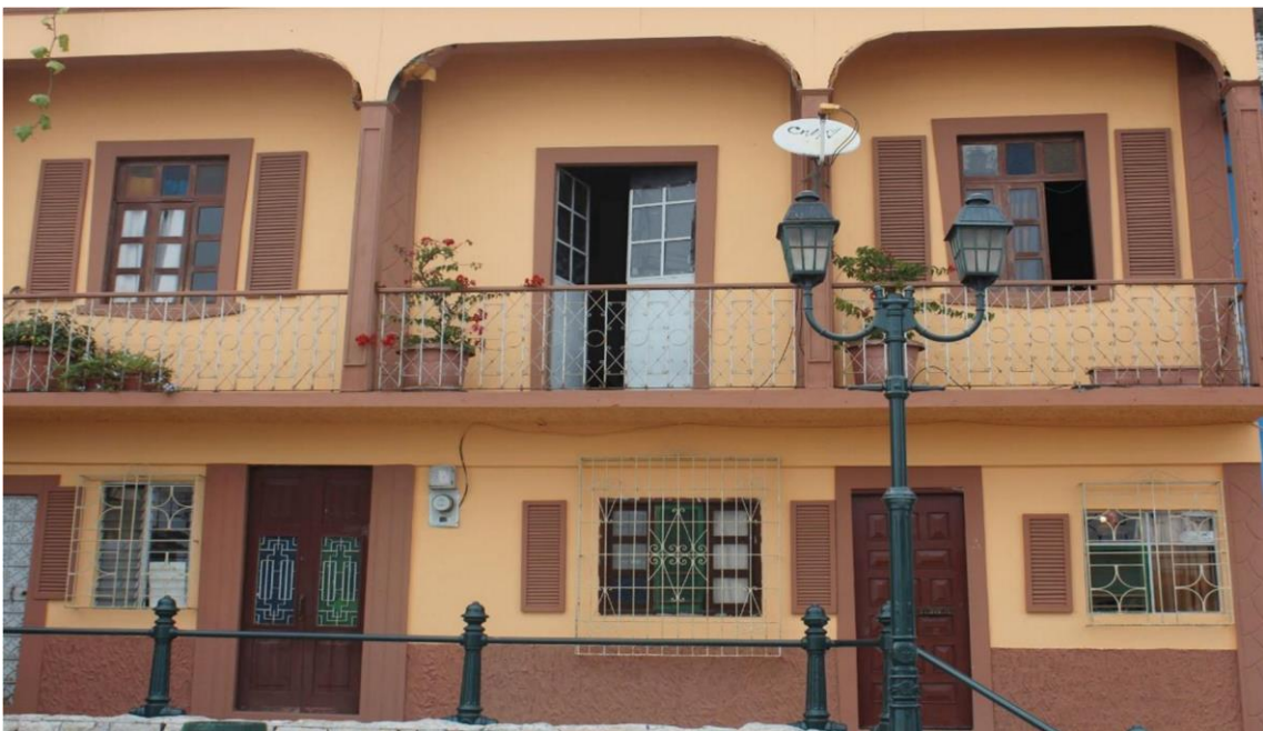
Figura 10. Visita de locaciones 4