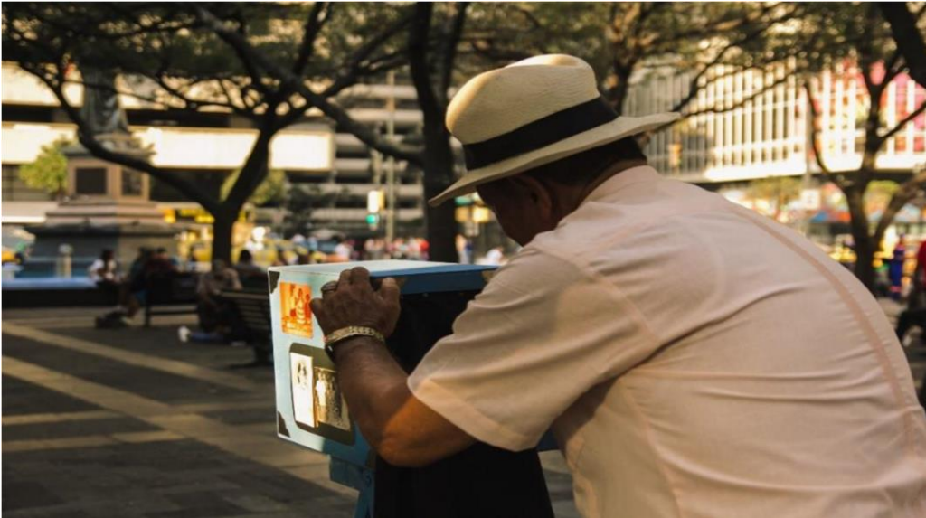
Figura 4. Sesión de fotos para el poster de casting 1 Moposita, 2019