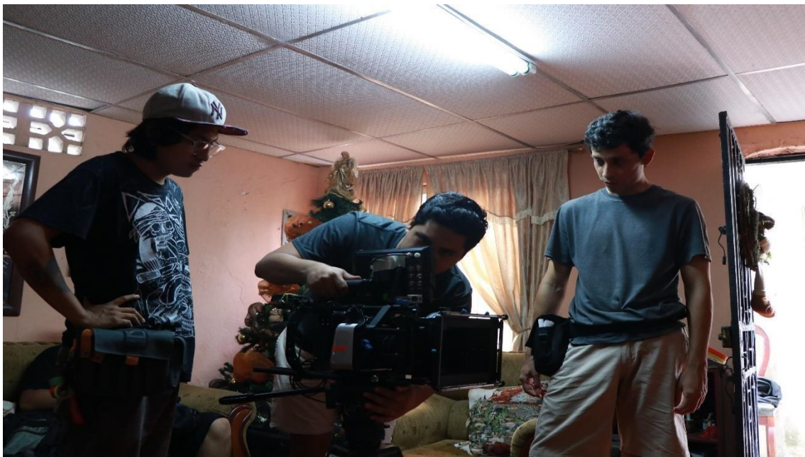
Figura 16. Rodaje 3 Moposita, 2019