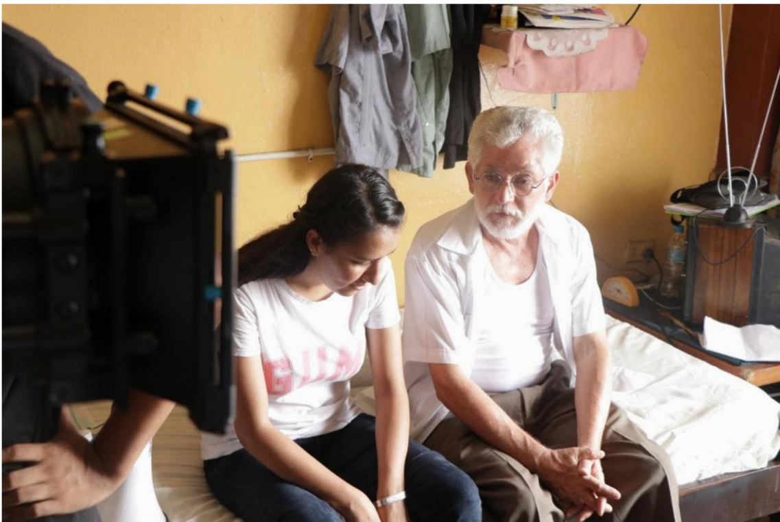
Figura 14. Rodaje 1