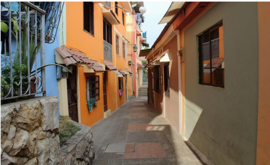
Figura 8. Visita de locaciones 2