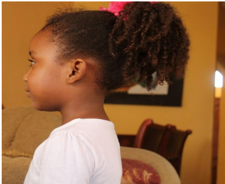
Figura 12. Casting 1 Moposita, 2019