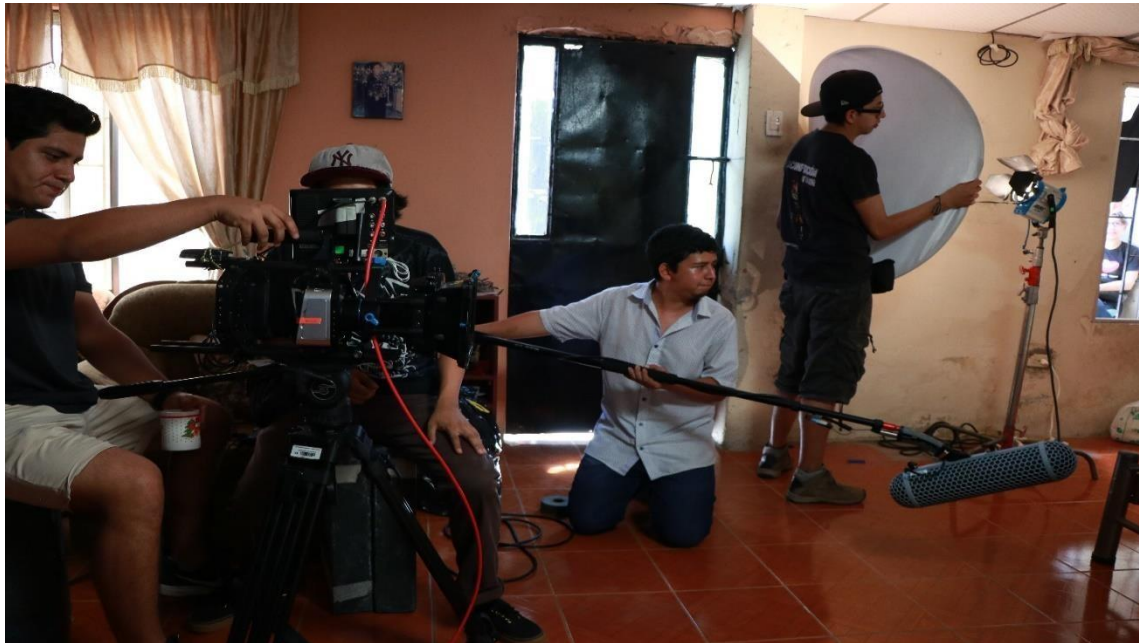
Figura 20. Rodaje 7 Moposita, 2019