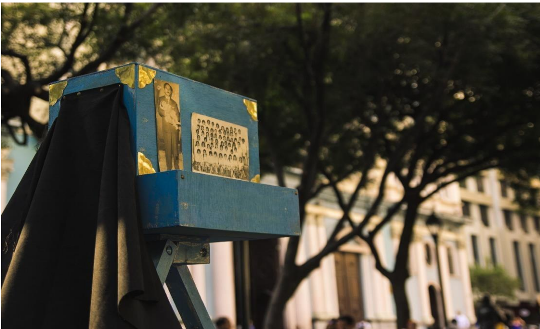
Figura 3. Sesión de fotos para el poster de casting y las postcards Moposita, 2019