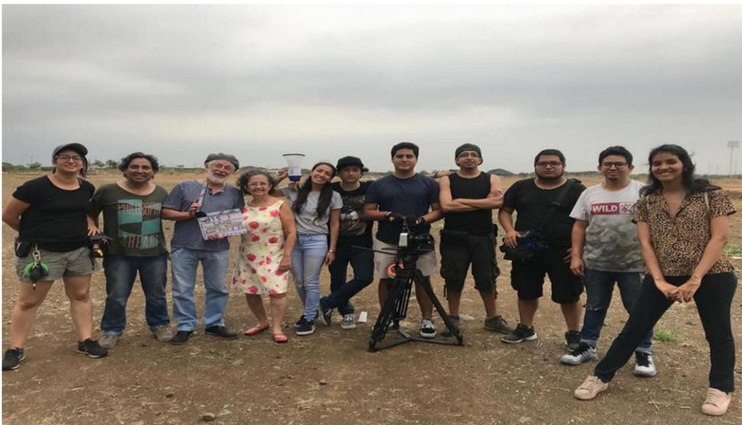
Figura 22. Rodaje 9 Moposita, 2019