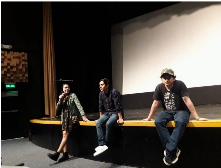
Figura 24. Proyección 2