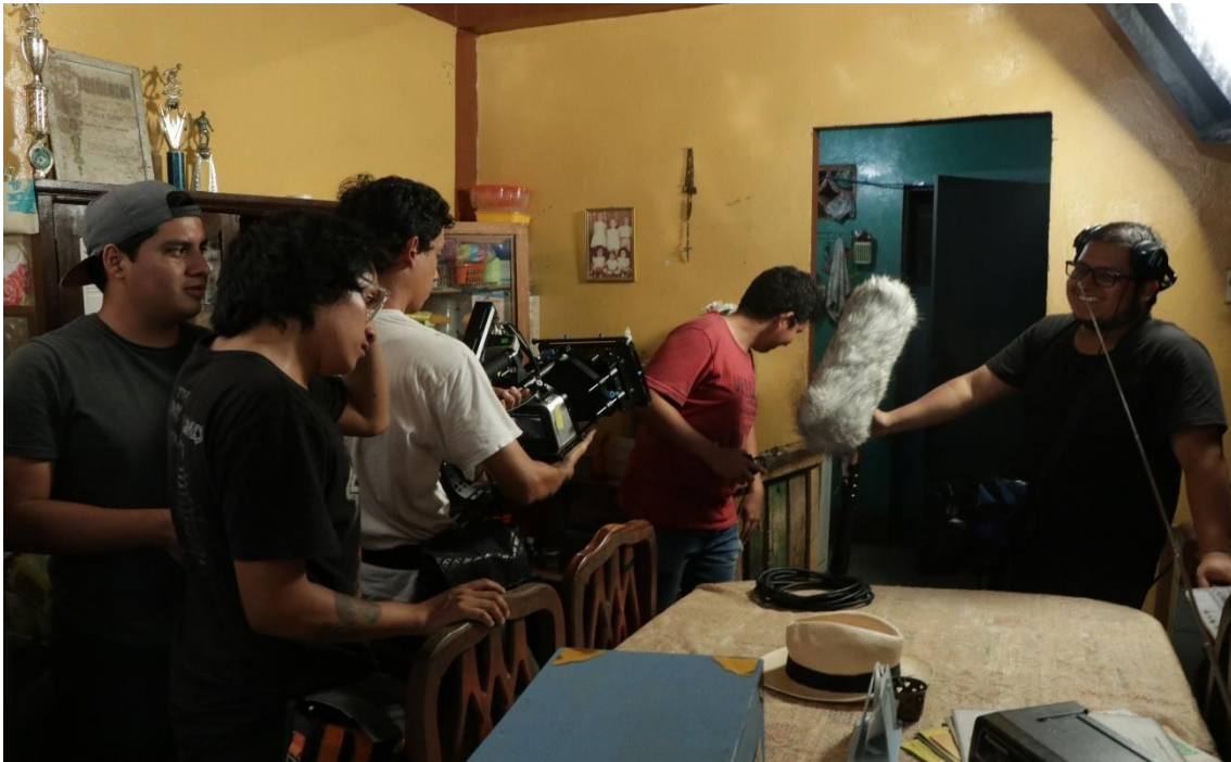
Figura 15. Rodaje 2 Moposita, 2019