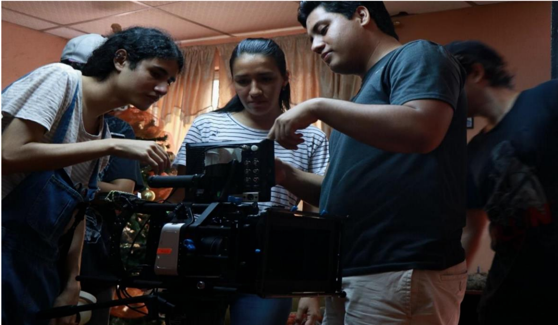
Figura 17. Rodaje 4 Moposita, 2019