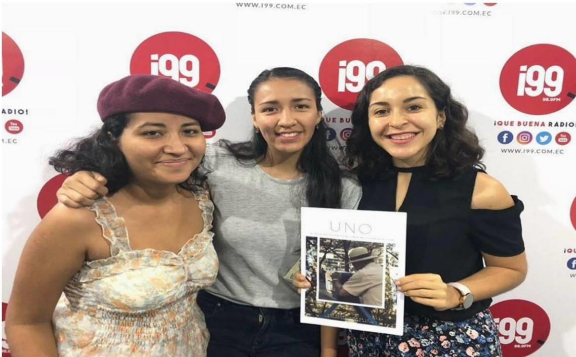
Figura 11. Visita de radios para llamado a casting Moposita, 2019