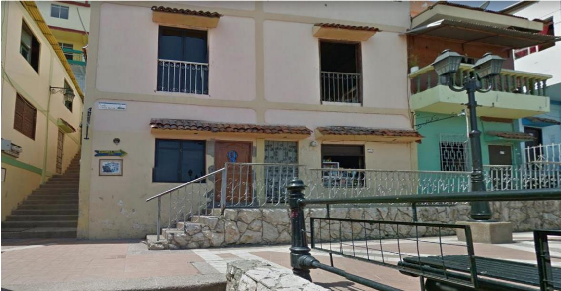
Figura 7. Visita de locaciones 1