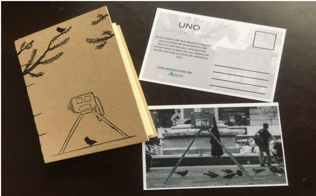
Figura 2. Post cards y libreta Moposita, 2019