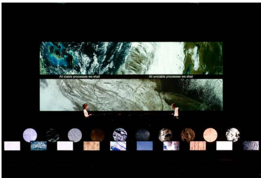
Imagen final tentativa acto I

Performance corporal-audiovisual frenética.