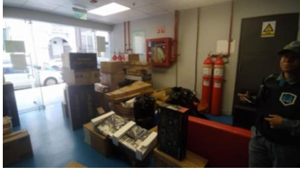
Sala de Postproducción Mz 14 donde se encuentran almacenados los instrumentos.