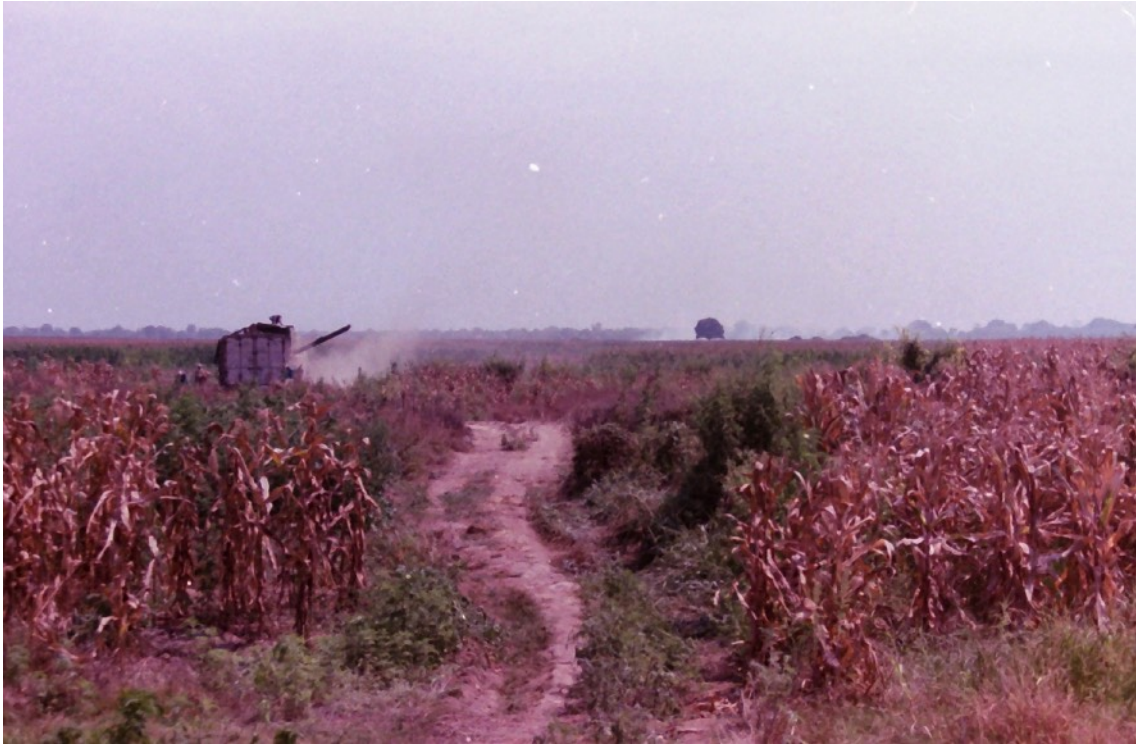
Bagatela, Vines, Noviembre 2019.