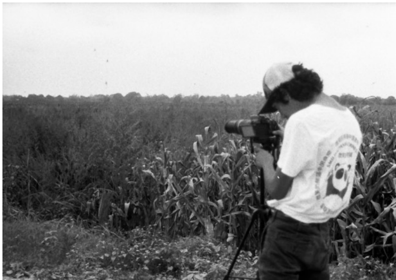
Detrás de cámara, Bagatela, Noviembre 2019.