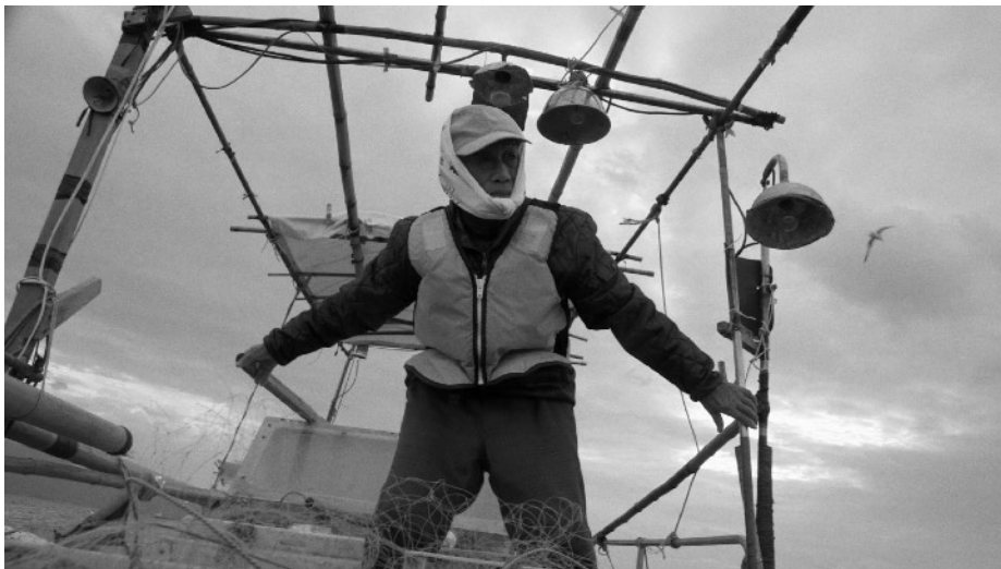
Fotogramas del filme observacional Inland Sea (2018)

ido transmutando poco a poco. Conforme los tiempos van cambiando, los métodos se van adaptando a las nuevas necesidades y contextos que surgen. La globalización, y las nuevas problemáticas que se presentan en el mundo; influyen en la narrativa y el realismo de los filmes. Por ejemplo, el cineasta chino Wang Bing, realizó una película llamada Tie Xi Qu: West of Tracks en el pueblo de Shengyang, China, al encontrar en es pueblo algo singular, el pueblo poco a poco iba pasando de ser un pueblo obrero de la china comunista a un pueblo “expandiéndose” al libre mercado. Bing registró la transición del comunismo al capitalismo en un pueblo chino dentro de las nueve horas que dura el filme. O como Soda, con su filme llamado Inland Sea , registrando a dos adultos mayores, viviendo sus últimos días dentro de una isla en Japón que va en declive debido a la baja tasa de natalidad. Soda captó la problemática social que esta atravesando Japón en estos tiempos a través de la historia de dos ancianos viviendo en su cotidianidad en la isla.