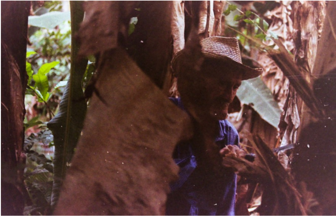
Bagatela, Vinces, Noviembre 2019.