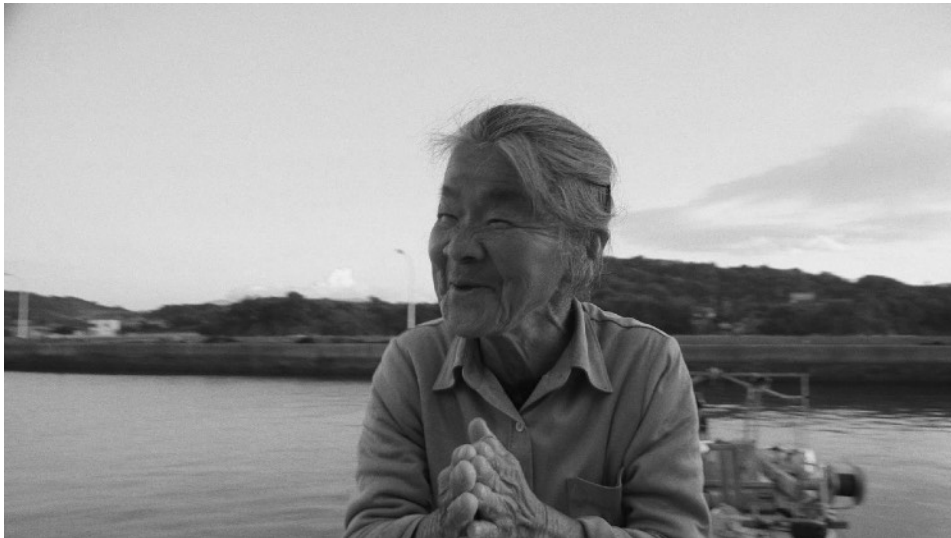
Inland Sea (2018)

observación de la cotidianidad de estos felinos. Por otro lado, en Inland Sea (2018) , Soda observa detenidamente a dos ancianos de una isla japonesa llamada Ushimado, registrando su cotidianidad junto a la vejez en una isla que está desapareciendo debido a la baja natalidad en el lugar; encontrando ahí problemas, contradicciones, testimonios tanto de los personajes, como de la sociedad, y del lugar.