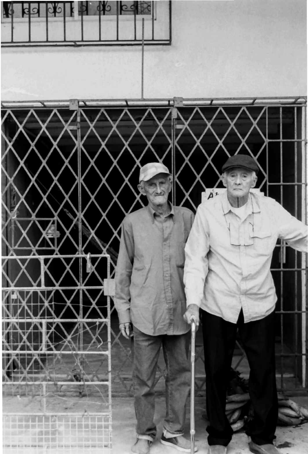
Último Encuentro, Vinces, 2019.