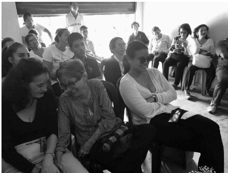
Fotos de la primera exhibición en la parroquia Antonio Sotomayor, Vinces.