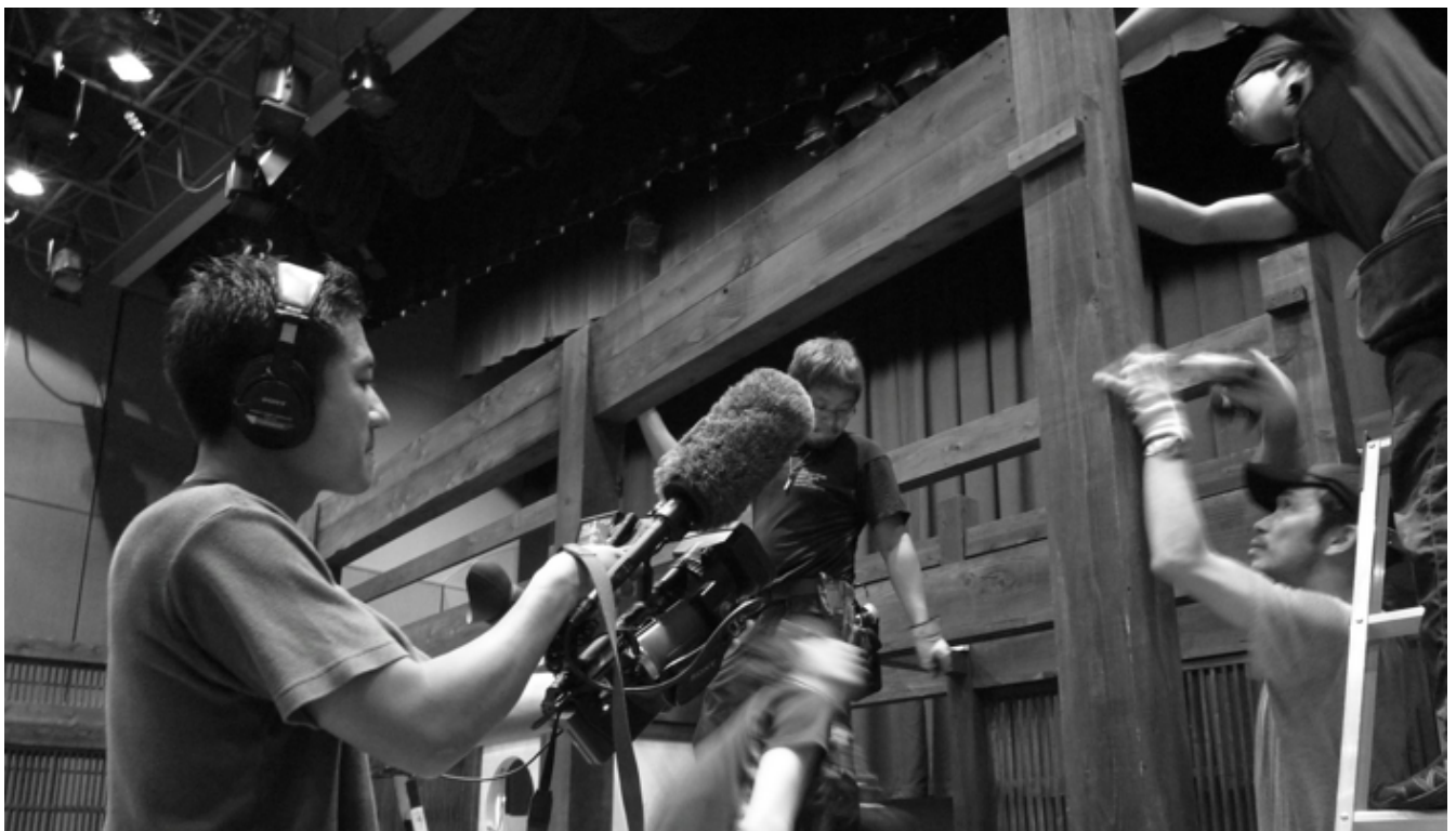
Kazuhiro Soda detrás de cámaras, Theatre (2008).