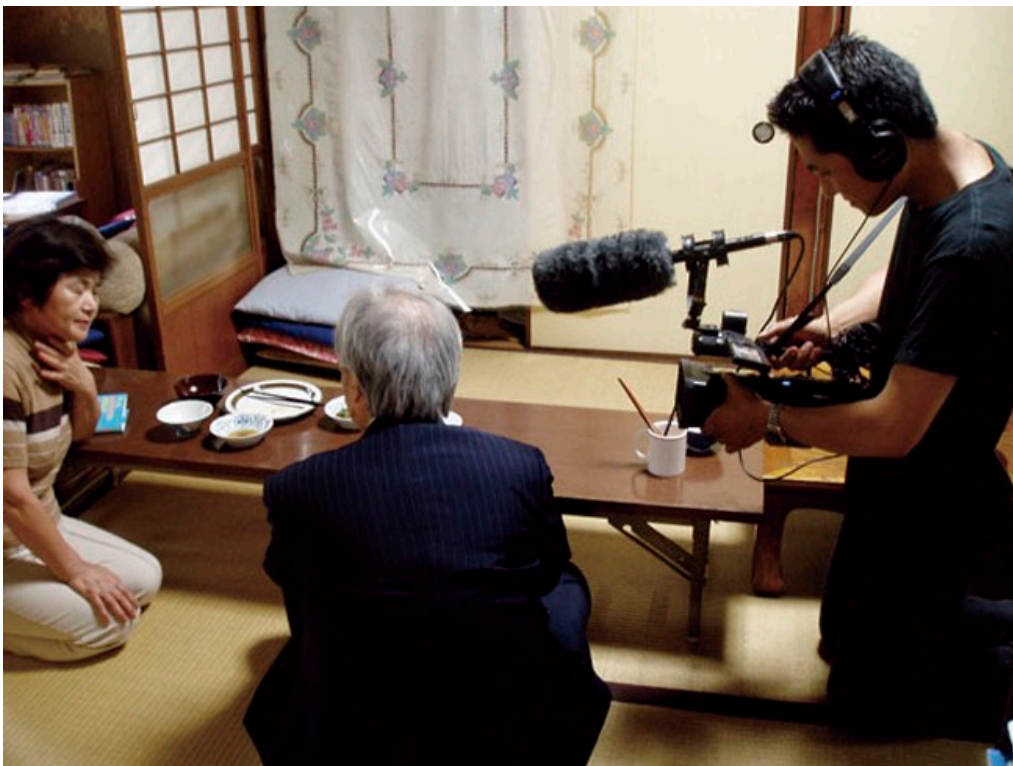
Kazuhiro Soda detrás de cámaras, Mental (2008).