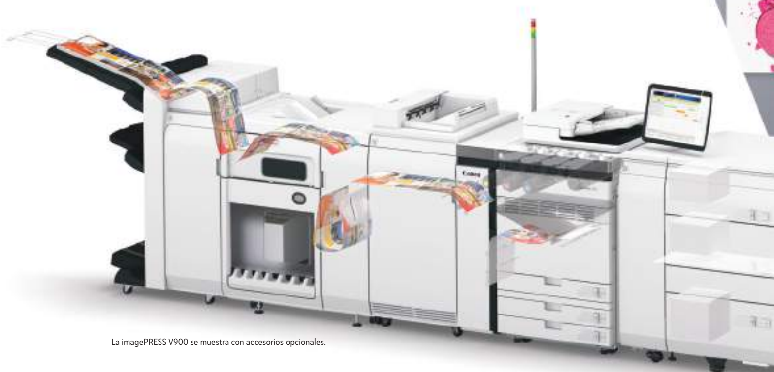
La imagePRESS V900 se muestra con accesorios opcionales.