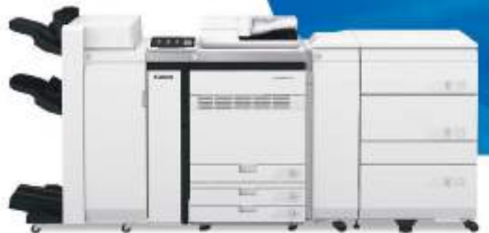
La imagePRESS V900 se muestra con accesorios opcionales.