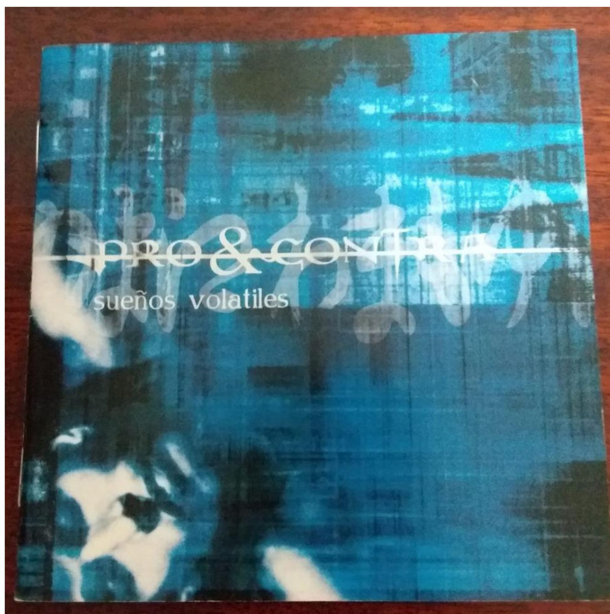
Imagen: Librillo del álbum “Sueños Volátiles” de Pro & Contra