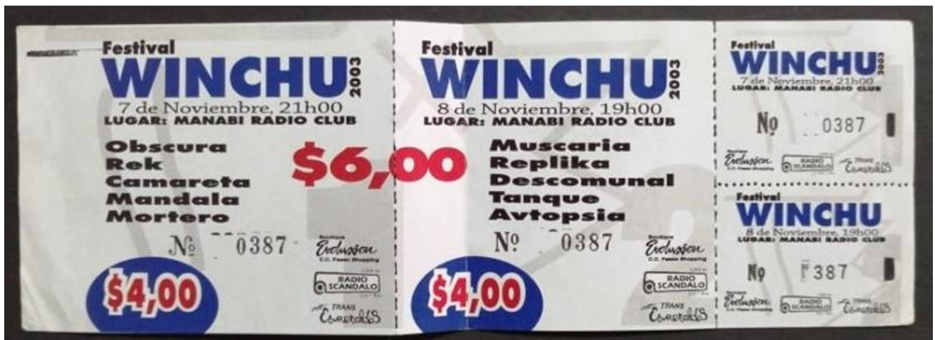
Imagen: Festival Winchu, 2003