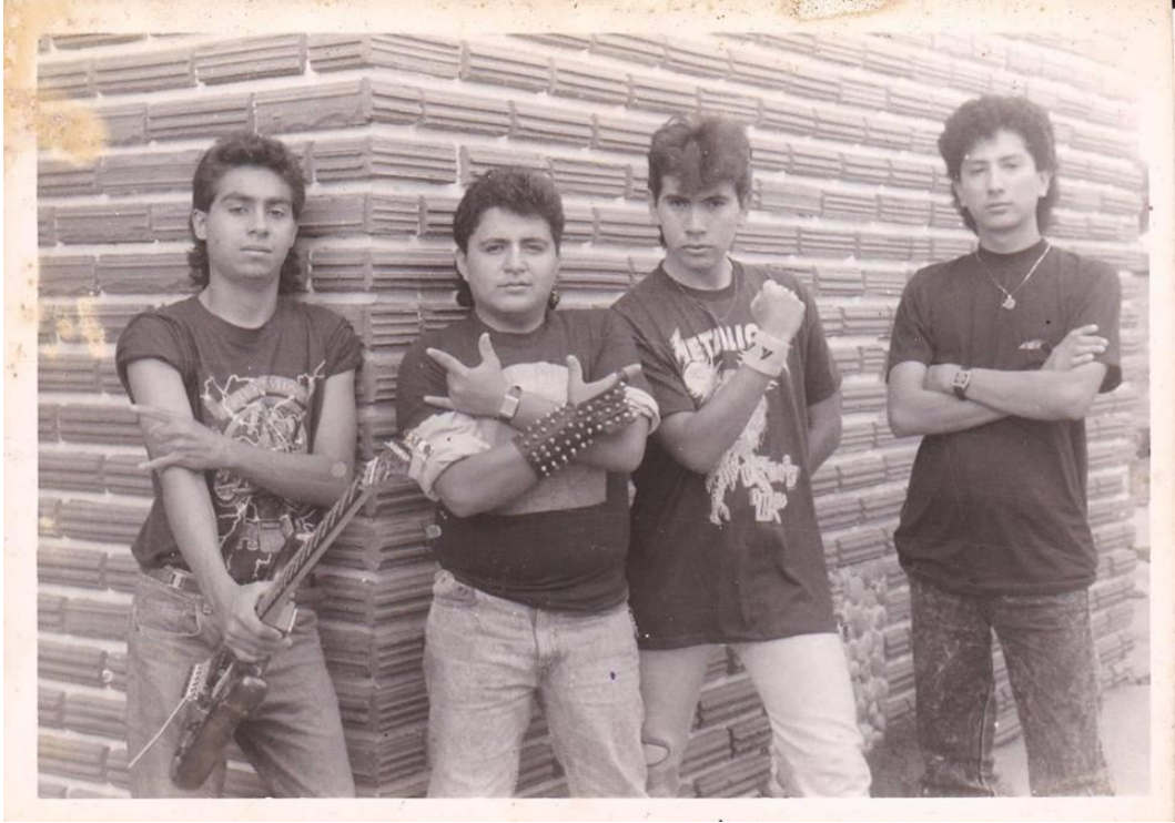
Imagen: Mortom, 1989