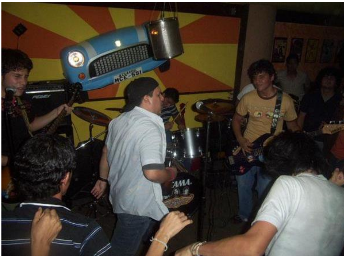
Imagen: Warros en La Fabrica Pub, 2006