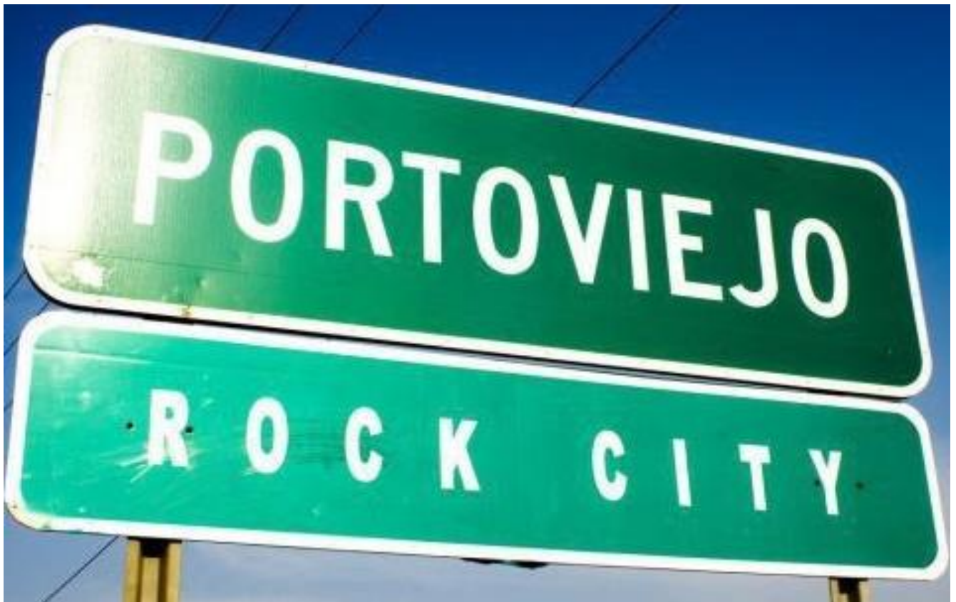
Imagen: Foto original del primer letrero de Portoviejo Rock City