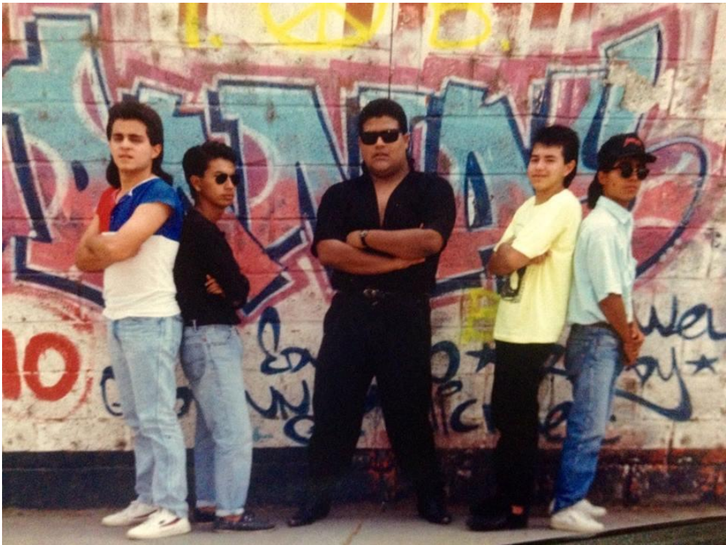
Imagen: Trash Beat, 1989