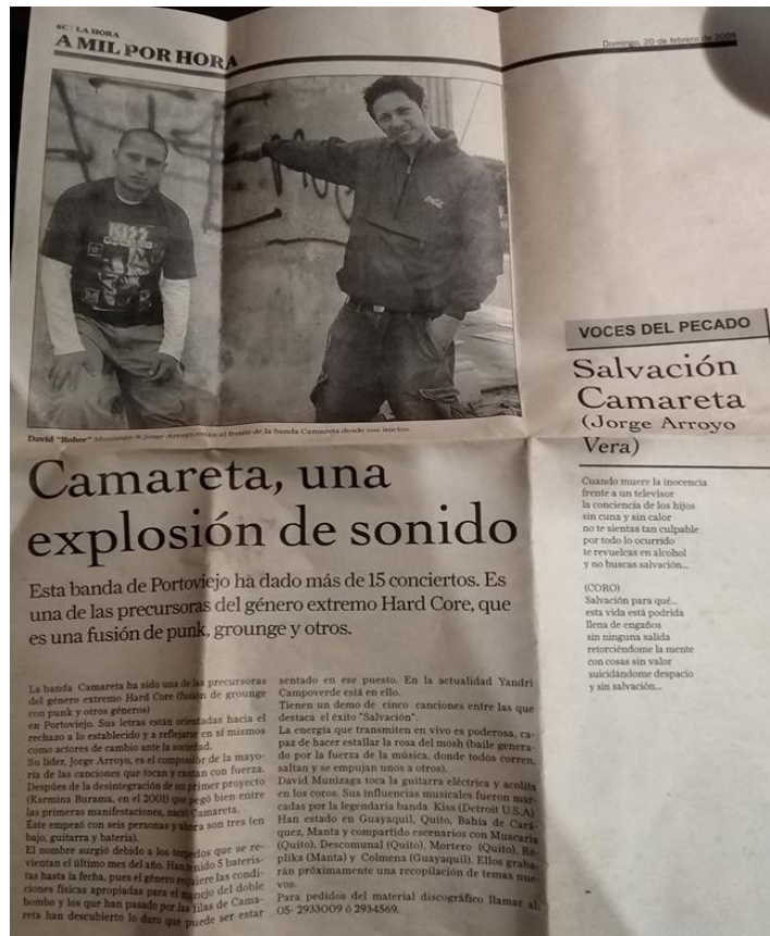
Imagen: Nota del diario "La Hora" sobre Camareta, 2005