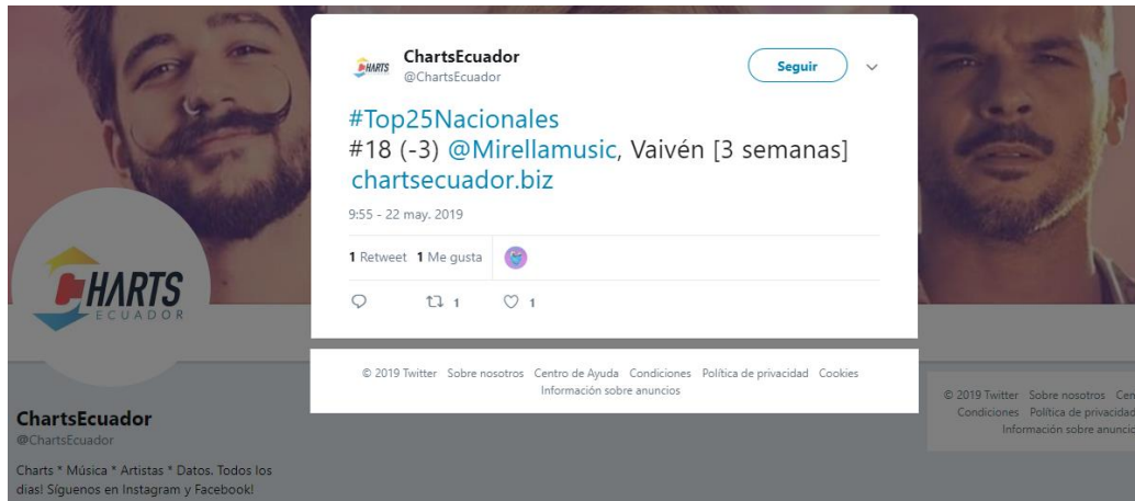
Imagen 2 – Chats Ecuador