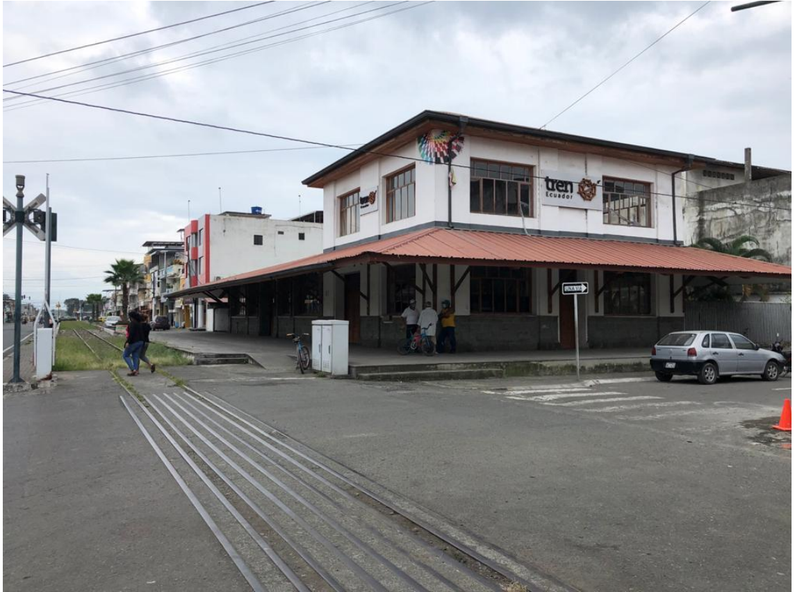
Exteriores de la Estación del Ferrocarril de Naranjito.