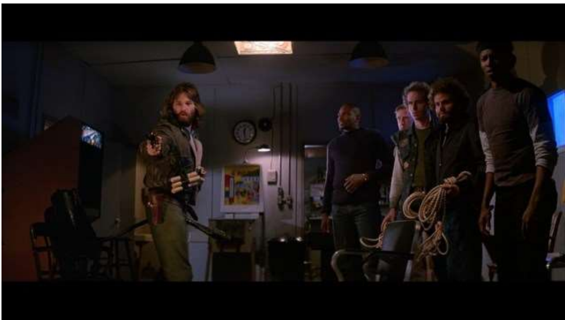
Los protagonistas de La Cosa (1982) atrapados en la base de la Antártida.