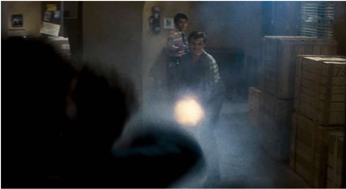
Los personajes sitiados en Asalto a la comisaría del distrito 13 (1976).

el mal no puede ser destruido, sólo disipado, y que incluso cuando los personajes logran alejarlo, una vez que ese “espacio confiable” ha sido invadido ya no pueden convencerse de que es seguro. El miedo a la amenaza permanece por siempre.