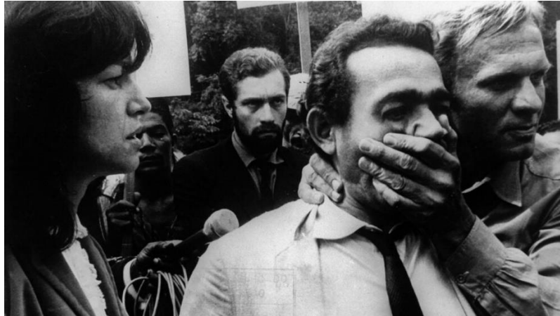
Ilustración 4. Fotograma de la película Terra em transe .