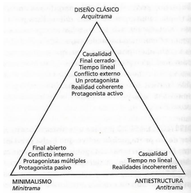
Ilustración 1. Triángulo de tipos de trama según Robert McKee

Ninguna trama es mejor que la otra simple y sencillamente se adecuan al tipo de historia que deseamos contar. Para identificarlas debemos recurrir a la naturaleza del conflicto que condicionará el actuar del protagonista es ahí donde radica el corazón del drama. Una vez identificadas las tres posibilidades lo que resta es detectar la narrativa y jugar con las características de cada una.