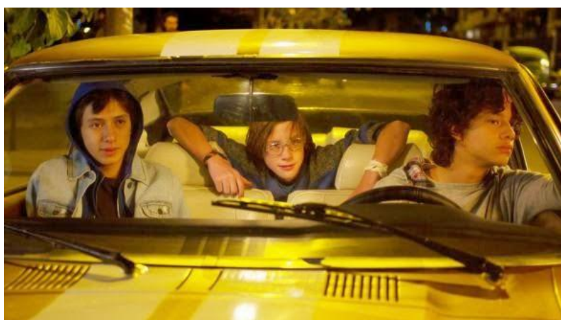
Ilustración 5. Fotograma de la película Ochenta y siete .

La película se refiere bastante al paso del tiempo, ya que cuenta dos historias paralelamente que abordan a los mismos personajes en dos instantes especiales de la vida: una, la juventud, que por primera vez descubren cosas; la otra, en su reencuentro. Por varias causas, dichos jóvenes se distancian y vuelven a converger en su etapa adulta.