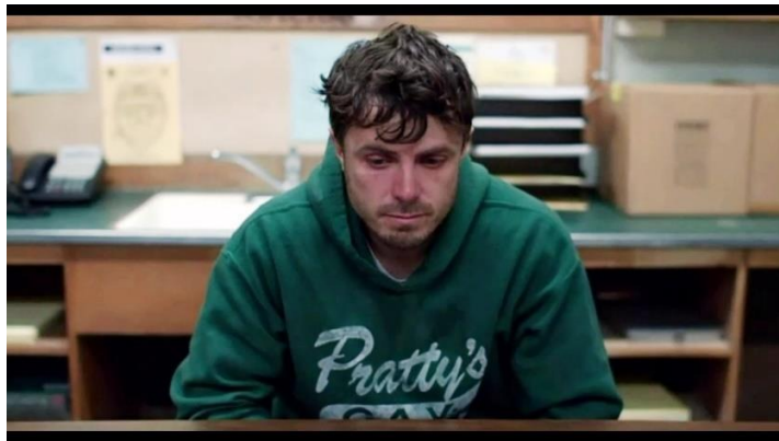
Ilustración 2. Fotograma de la película Manchester by the sea .

algo que comprender sobre el cine y sobre cualquier arte es que generalmente no hay métodos universales. Lo que parece funcionar en una película puede que no funcione en otras eso es lo que sucede con el flashback, un recurso que a primera vista podría resultar bastante interesante o de forma directa un reflejo de la pereza o la escasa agilidad de un autor cuando quiere empezar a escribir un guion. Presentar es fundamental y es preferible realizarlo en vez de contar, dicho de otra manera, la información que se le da al espectador debe verse exhibida por medio de imágenes y no de palabras. Esto no supone que los personajes no van dialogar jamás, sino que las conversaciones que van a tener y las cosas que hablen, deberán ser naturales y sinceras, y no con el fin de ser mencionadas únicamente para describir la historia al espectador por medio de un diálogo artificial.