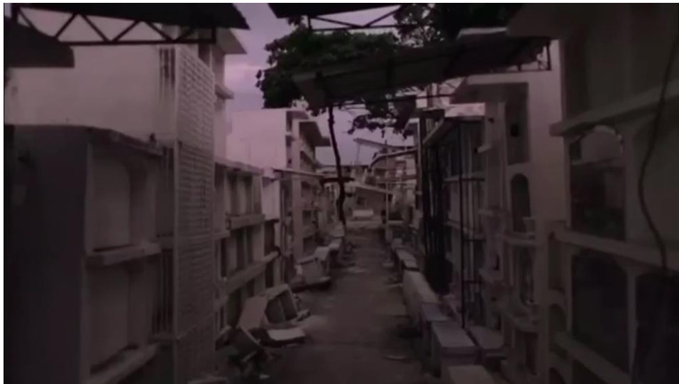
Ilustración 6. Fotograma del documental 52 segundos.

terremoto del 16 de abril, esto debido a que a través del lenguaje cinematográfico aborda el significado de la pérdida y la memoria, en contraste con el crecimiento y la creación de nuevos recuerdos una niña. De esta manera este film busca crear una correlación entre la muerte y el nacimiento de una nueva época, mediante los acontecimientos que rodean al director y a su sobrina.