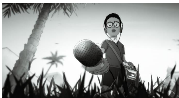
Ilustración 3. Fotograma de la película Je perdu mon corps

Otro de los films que también construye la idea de flashback a través de su narrativa es Je perdu mon corps , una película animada francesa que llama la atención por su sinopsis pero que engancha por la dificultad de una historia llena de suspenso, amor y superación. Todo empieza con una mano cortada huyendo de un laboratorio con el exclusivo objetivo de hallar a su cuerpo humano. En el camino, recordará su historia con el adolescente al que una vez estuvo apegado desarrollando de esta manera dos narraciones paralelas. En una de ellas, se muestra el viaje de una mano desmembrada que recorre las implacables calles de París, para descubrir a su legítimo propietario. Durante ese tiempo, a modo de flashbacks de la mano, empieza a realizarse otra historia en la que un adolescente denominado Naoufel batalla por hallar el objetivo de su vida.