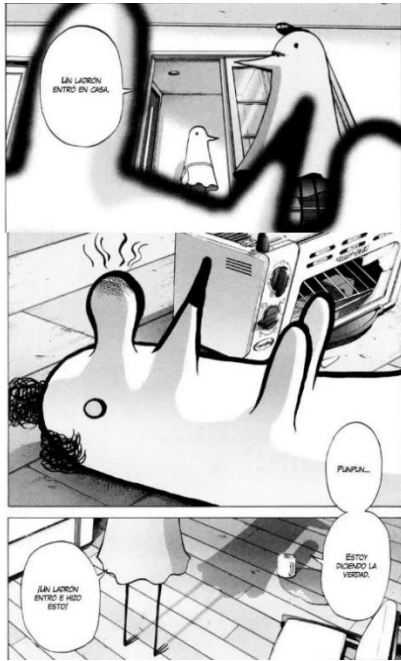
4. Extraído de Oyasumi Punpun , Inio Asano, 2022.