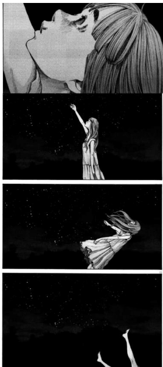
6. Extraído de Oyasumi Punpun , Inio Asano, 2022.