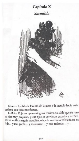
3. Ilustración de John Tenniel para Alicia a través del espejo.

Como antecedente para la ilustración presento al mangaka Inio Asano 8 con su historia “Oyasumi Punpun” ( Buenas noches, Punpun ), en la cual, nos envolvemos en la historia de un niño llamado Onodera Punpun y observamos su crecimiento alrededor de personas que ven la muerte como la liberación de sus problemas. Abarca temas como la despedida, la soledad, la injusticia, la violación y la muerte, detrás de una línea gráfica muy característica del autor, combinando el realismo con la exageración; sin embargo, el protagonista del manga y sus familiares se presentan en modo de caricatura porque Punpun no los considera como personas que habitan en la sociedad que lo rodea. Esta expresión artística que tiene Inio Asano sobre su