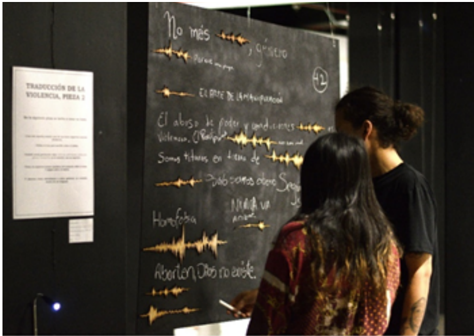
Figura 3: "Efectos lingüísticos".