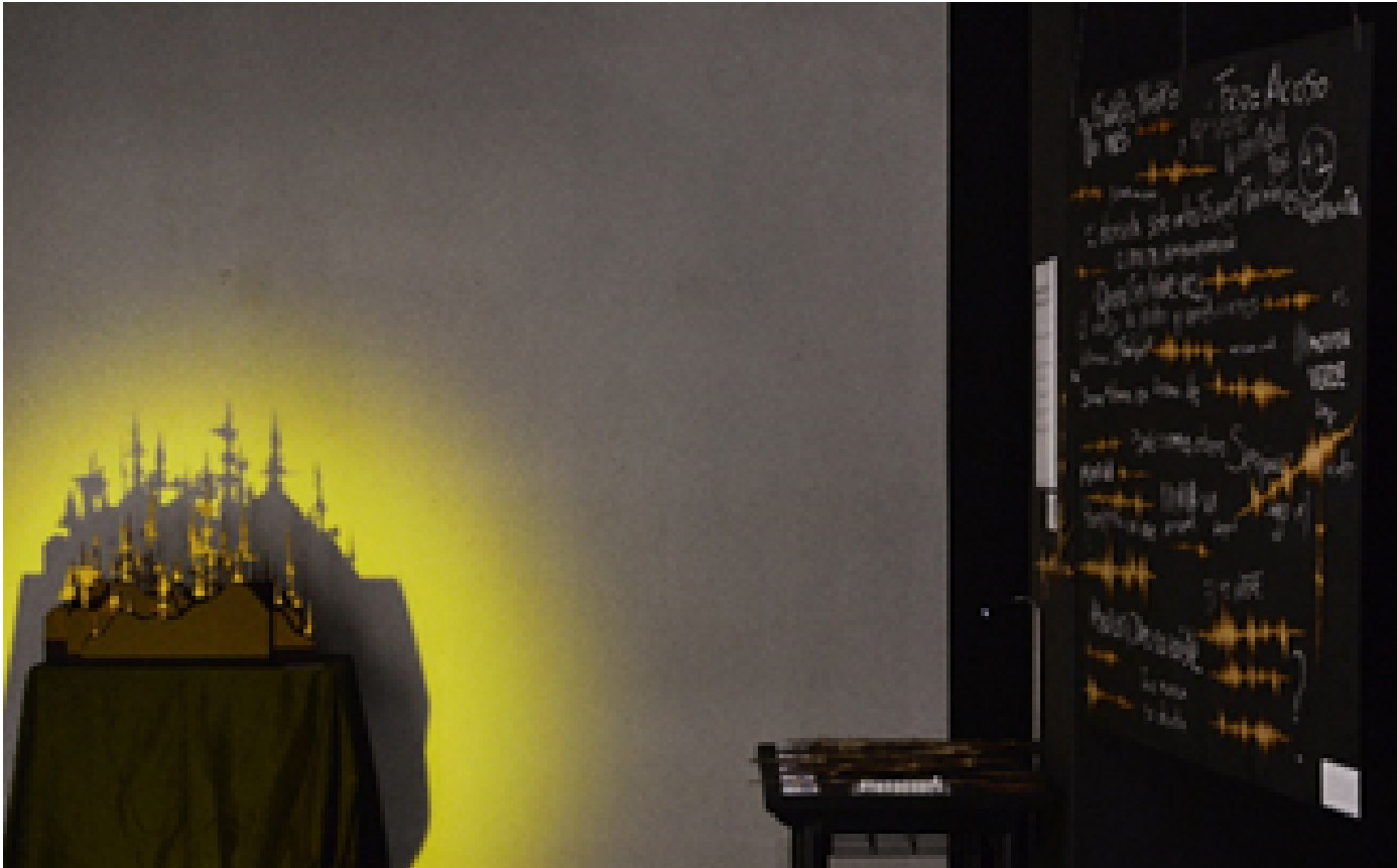
Figura 1: A la izquierda: "Bosque de palabras". A la derecha "Efectos lingüísticos".