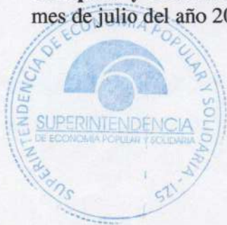
CARLOS NARANJO MENA INTENDENTE ZONAL 5

Cúmplase y Comuníquese.- Dado y firmado en la ciudad de Guayaquil, a los 15 días del mes de julio del año 2015.