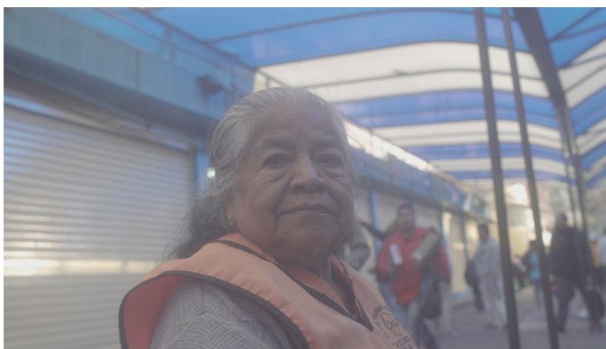
Lente Rokinin 28mm 1,4f; ; Black Promist \frac{1}{4} ; ND9; slog-2