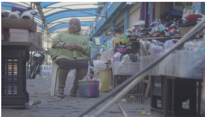
Lente Rokinin 35mm; 1,8f; Black Promist \frac{1}{4} ; ND9; slog-2

Aquí unas referencias visuales en cuanto a ópticas que se lograron en el scouting: