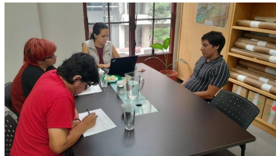
Reuniones planificación con docentes asesores del proyecto: