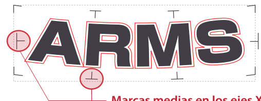
Marcas medias en los ejes X e Y

Área de Compensación Segmentada (X-Y) Reconoce las marcas medias entre las marcas de registro para corregir distorsiones en los ejes X/Y incrementando así la precisión al cortar trabajos largos.