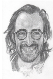
Retrato por Luis Reinoso