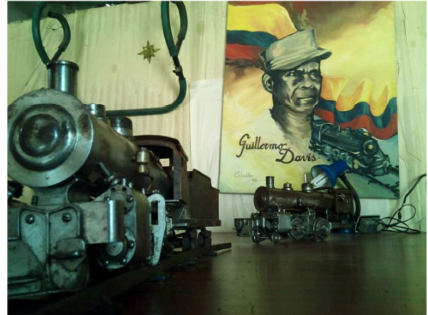
Figura 2. Las gemelas- máquinas inconclusas de Davis, Fotografía de Pedro Villegas. 2013, Durán

Su principal motivación, era haber crecido en la época de oro del ferrocarril, cuando el tren era visto como un emblema, un símbolo del progreso y la máxima atracción