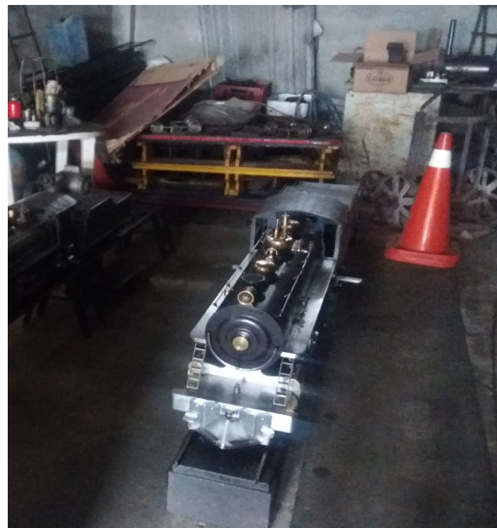
Figuras 4 y 5. A la izquierda: Locomotora a escala # 1. A la derecha: Locomotora a escala # 2, tiene 47 cm de alto, 34 cm de ancho y 320 libras de peso. Fotografía. Taller hnos. Davis. 2016.