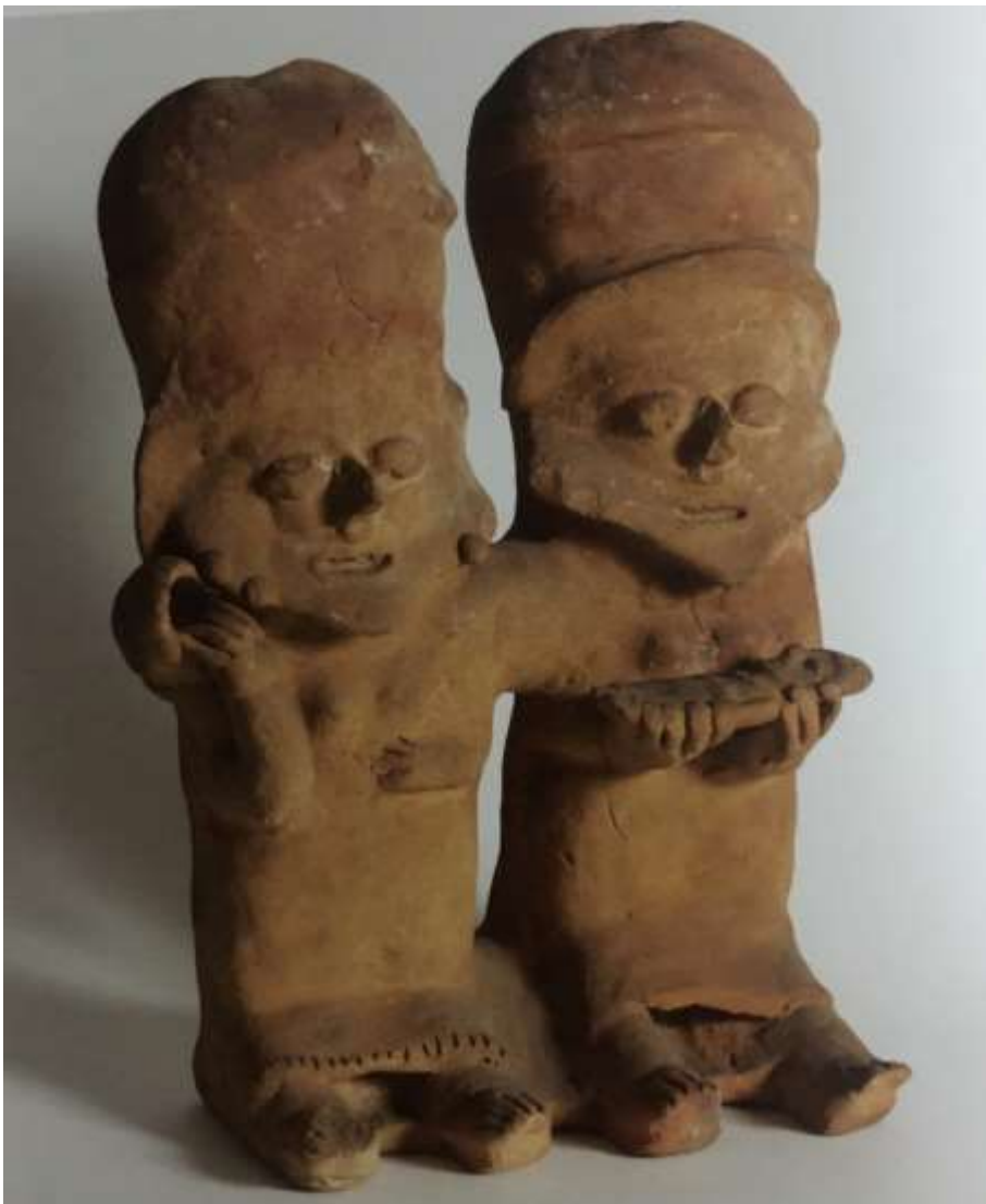
Figura antropomorfa de dos mujeres y un niño en brazos, cultura Bahía, cerámica, 32,2 x 24,2 x 13,3 cm.

Por estas razones, algunas figuras del altar de nuestra protagonista tienen semejanza con las siguientes imágenes que corresponden a figurillas prehispánicas del territorio ecuatoriano curadas por María Fernando Ugalde y Hugo Benavides en la cuarta exposición temporal del Museo Nacional del Ecuador titulada: DIVERS[JS]: facetas del género en el Ecuador prehispánico .