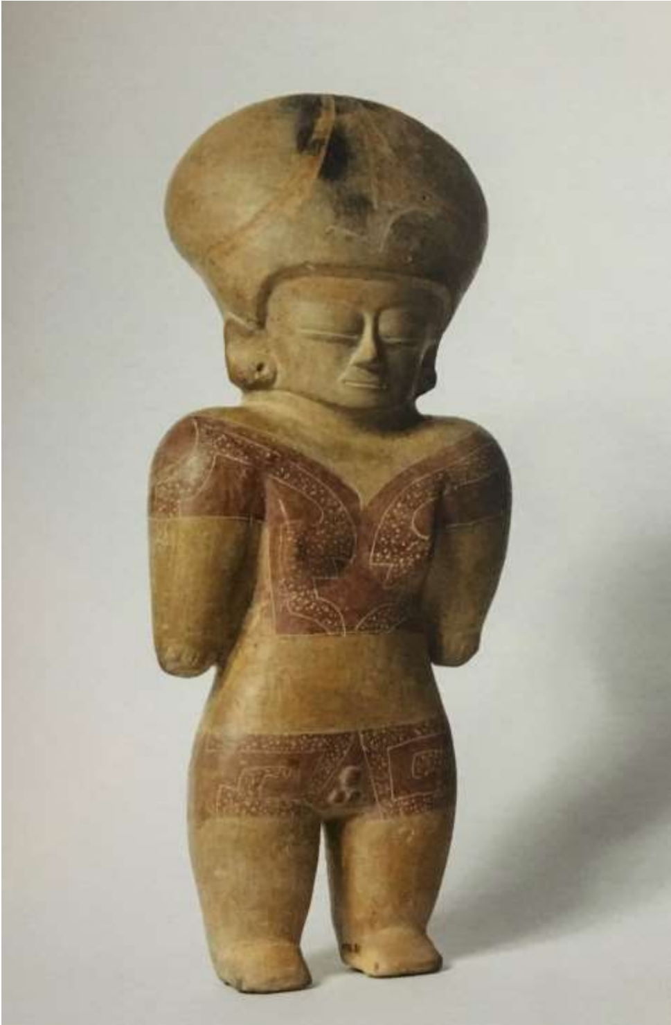
Figura antropomorfa con rasgos sexuales masculinos y femeninos, cultura Chorrera, cerámica, 38,5 x 16,3 x 9,8 cm.