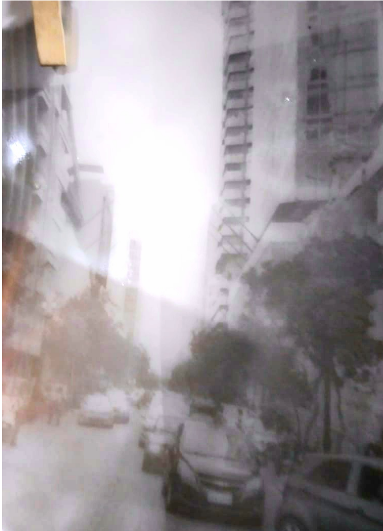
Figura 6.3 _Enero _2021

Para la creación de esta fotografía, mi padre tuvo mi ayuda, ya que era un lugar con una alta afluencia de personas y vehículos, fue tomada alrededor de las 11 a.m. en el centro de la ciudad de Guayaquil. En esta fotografía se utilizó ISO 100, velocidad 200, Diafragma 5.6 y sistema métrico en infinito.