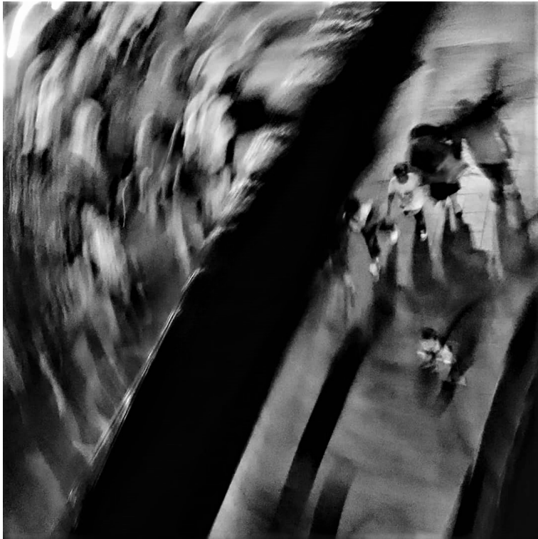
Figura 6.13- Diciembre _2020

Esta fotografía fue tomada durante la noche en el centro de Guayaquil, se utilizó la técnica del riar, esta técnica fue descrita por Vicente. De acuerdo a sus comentarios, él indica que así percibe el mundo, donde hay un desenfoque y un movimiento circular; se la realizó utilizando velocidades bajas 1/10, ISO 400-f2.8.