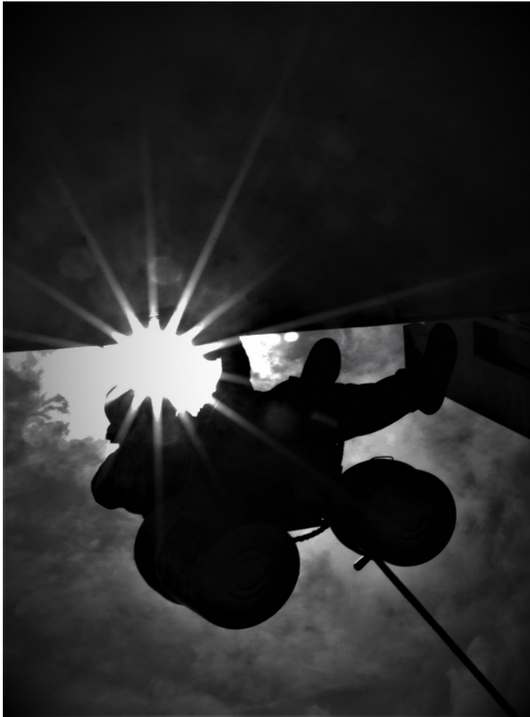
Figura 6.12 _ noviembre 2020

En esta fotografía podemos observar a una persona trabajando colgado de un columpio, esta imagen se realizó contra picada y en contraluz, la guía de Castro fue captar a una persona en contraluz, buscando la fuga de luz, esto nos permitió obtener una imagen donde se observa al personaje acercándose al sol. Se utilizó un diafragma f22 que es cerrado, ISO 100, y velocidad 400.