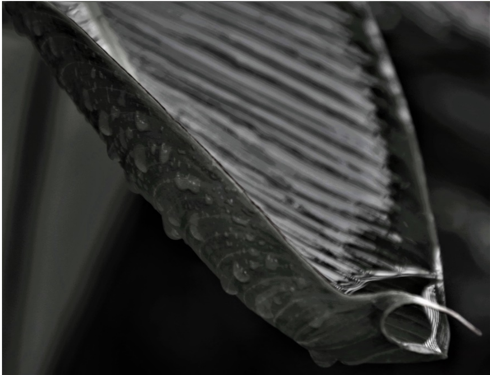
Figura 6.4 _ Marzo_2021

Esta imagen fue hecha del rocío de la lluvia sobre una hoja, la misma evoca la frescura por sus gotas y nos trasmite una sensación de tranquilidad, esta imagen juega con la imaginación del espectador. Las líneas siempre las encontramos en nuestras fotografías, éstas se ordenan y distribuyen, guiando la mirada, lo que mejora la fotografía. Las líneas que conforman esta imagen son geométricas y tanto las sombras como los espacios vacíos se vuelven un apoyo en la composición de la imagen si convertirse en el centro de atención de la misma. Vemos como la tonalidad del negro y los grises prevalecen en la imagen reflejando elegancia y tranquilidad.