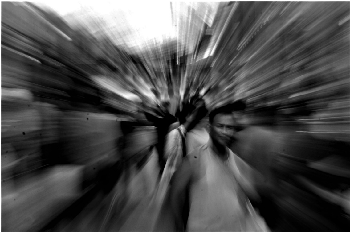
Figura 6.11 _ Diciembre _2020

Esta foto fue tomada en el centro de la ciudad en el sector conocido como Bahía, para su creación se utilizó la técnica del riar, esta técnica fue definida por Vicente Castro, utilizando velocidades bajas 1/30 , e ISO 400-f16 y un teleobjetivo, este último se mueve atrayendo y alejando a la persona para poder llegar obtener este efecto entre el movimiento y tiempo.