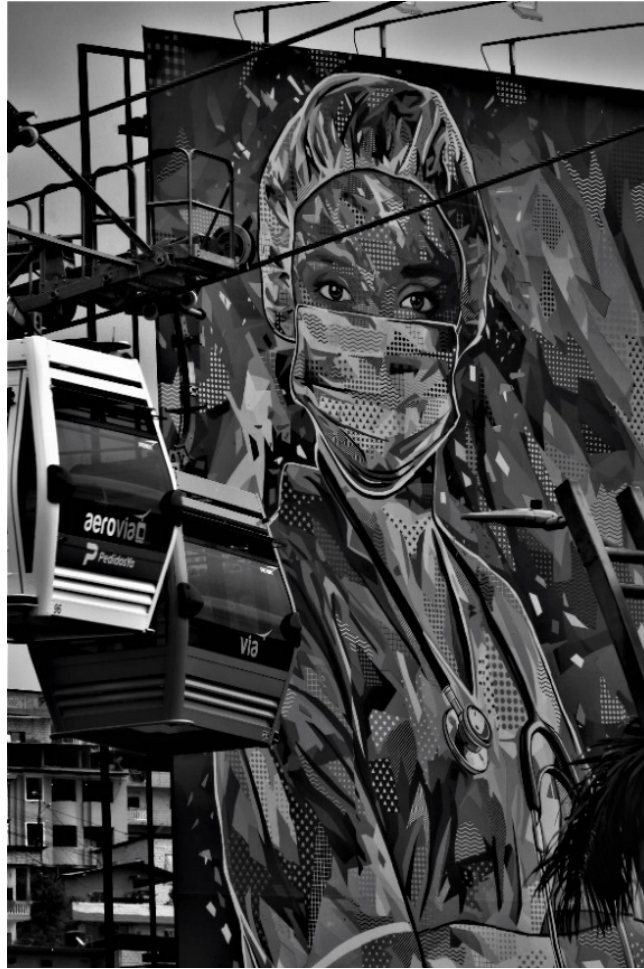
Figura 6.6 _ Marzo _2021

Lo irreverente y arbitrario de esta imagen fotográfica es la propia imagen que se representa y como el espacio público es usado para que la misma sea parte de un recorrido, el mural tiene a una persona que pertenece al equipo de salud de sexo femenino que sostiene sus manos cruzadas, esta postura transmite firmeza, el poder de la imagen y tiene la mirada fija haciendo creer que nos está observando en esta imagen también prevalecen las líneas y círculos. La imagen del muro constituye el fondo de dos de las cabinas de la novedosa aerovía, instalada en la ciudad, misma que ha sido fuente de críticas y oposiciones, debido a su costo- función, lo cual simbólicamente se contrapone con el mural y los servicios de salud, a los cuales, en medio de la pandemia, no se han financiado.