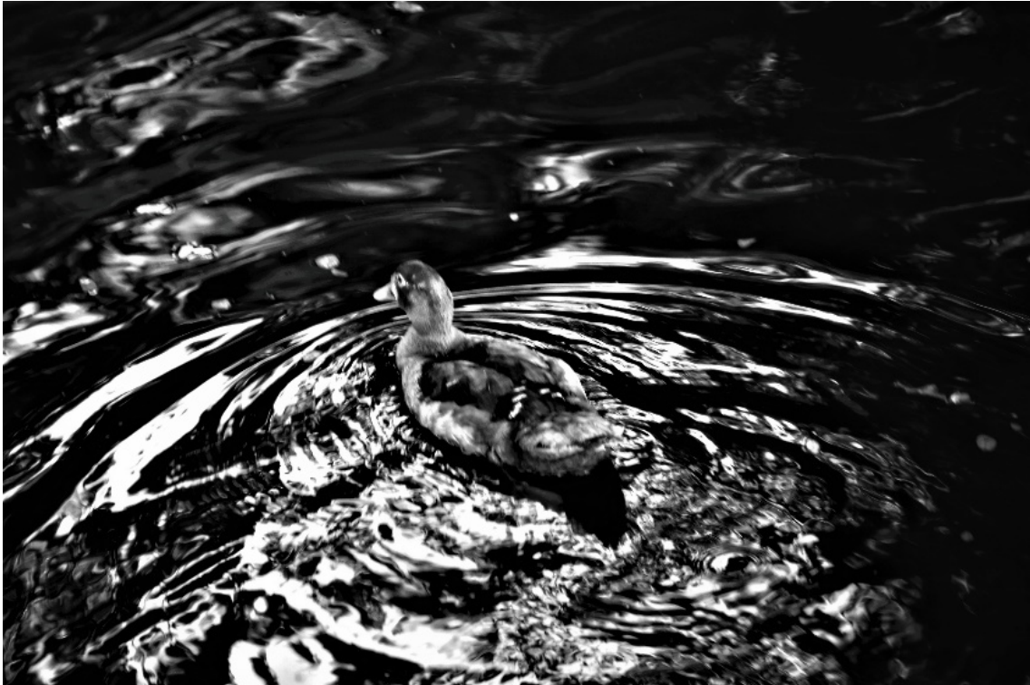
Figura 6.5 _ Marzo _2021

En la fotografía podemos contemplar a un pato, esta imagen se capturó mientras el animal se mantenía en movimiento en el agua, dichos movimientos formaban imágenes circulares en el estanque. Al igual que en la figura 6.4 estas líneas se vuelven complementos de la imagen resaltando al personaje principal de la misma. De igual manera las tonalidades grises prevalecen en la imagen.