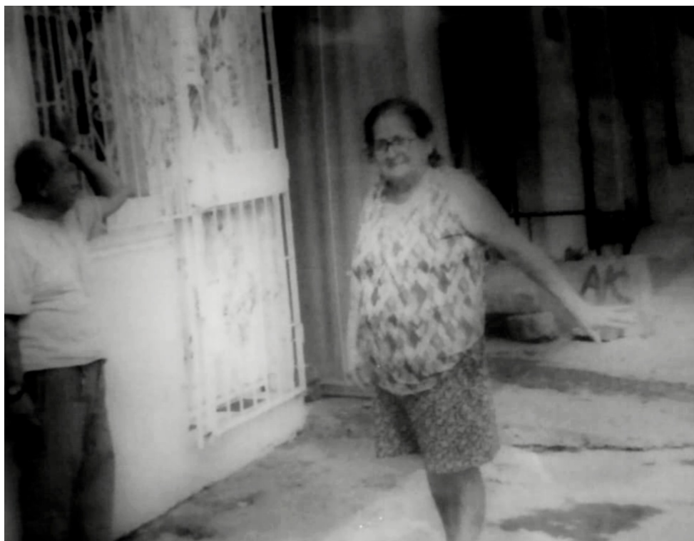
Figura 6.1 -Febrero_ 2021

Esta fotografía fue tomada por mi padre Vicente, recreó la imagen encontrada en sus archivos personales y que aún recuerda, en la imagen original se encontraba su hermana, para su recreación le pidió a su cuñada que sirviera de modelo, debido a que su hermana falleció hace varios años, además de los cambios en los personajes, también se